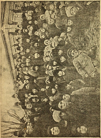
Ленин среди крестьян дер. Кашино 14 ноября.