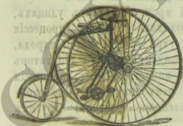
THE SANDRINGHAM CLUB

всѣхъ системъ и принадлежности къ нимъ же.