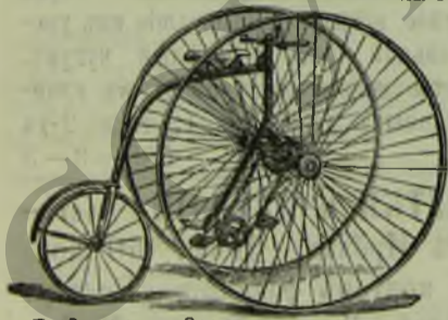
THE SANDRINGHAM CLUB

всѣхъ системъ и принадлежности къ нимъ-же.