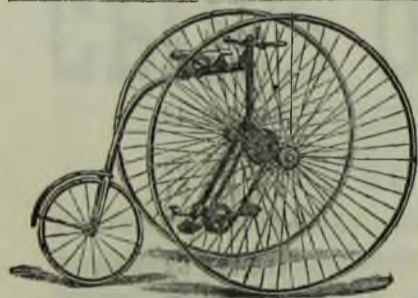
THE SANDRINGHAM CLUB

Управленіе Уральской Горнозаводской желѣзной дороги доводитъ до общаго свѣдѣнія, что, на основаніи §§ 40 и 90 общаго Устава Россійскихъ желѣзныхъ дорогъ, 30 ноября сего 1886 года, въ 12 час. по полудни, въ залѣ III класса станціи „Пермь“, назначается продажа съ публичнаго торга непринятыхъ товаровъ и найденныхъ разныхъ предметовъ, оставленныхъ пассажирами въ вагонахъ и станціонныхъ помѣщеніяхъ, опубликованныхъ въ „Пермскихъ Губернскихъ вѣдомостяхъ“ за № 60, отъ 26 іюля сего года и въ „Екатеринбургской Недѣлѣ“ за № 28, отъ 20 іюля сего же года. 604-3-3