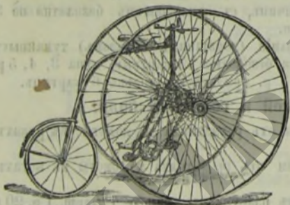
THE SANDRINGHAM CLUB