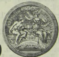
Золотая медаль, Парижъ 1889 г.

Майглекхенъ. Резеда. Флеръ-д'Оранжъ. Эссъ-фловверсъ. Гелиотропъ.