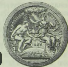
Золотая медаль, Парижъ 1889 г.