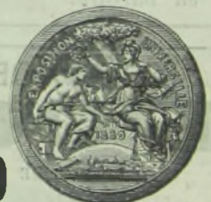
Золотая медаль, Парижъ 1889 г.