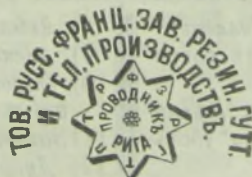
Фабричное клеймо звѣзда съ надписью фирмы Т-ва (выпуклое).