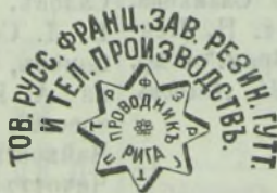
Фабричное клеймо звѣзда съ надписью фирмы Т-ва (выпуклое).