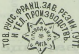
Фабричное клеймо звѣзда съ надписью фирмы Т-ва (вышуклое).