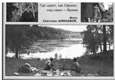
Где царит, как Сфинкс, над нами — Время.