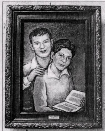
Работа Александра Круглова.