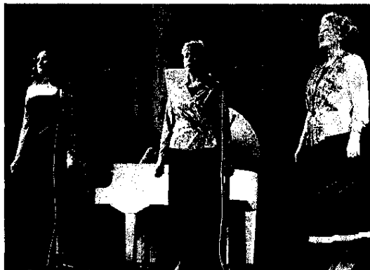
Так звучит «Гармония».

«Поющий край», приуроченный к 277-му дню рождения Первоуральска, получился очень ярким. Свои краски в фольклорном звучании нашла динасовские «Славянка», «Сударушка», «Этно-ретро». Народный коллектив татарской культуры «Тургай» был настолько артистичным, что аплодис-