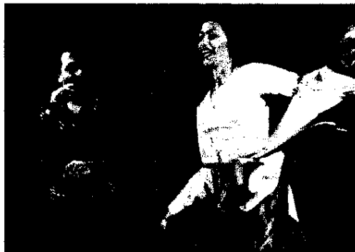
Зажигательные цыганские ритмы.