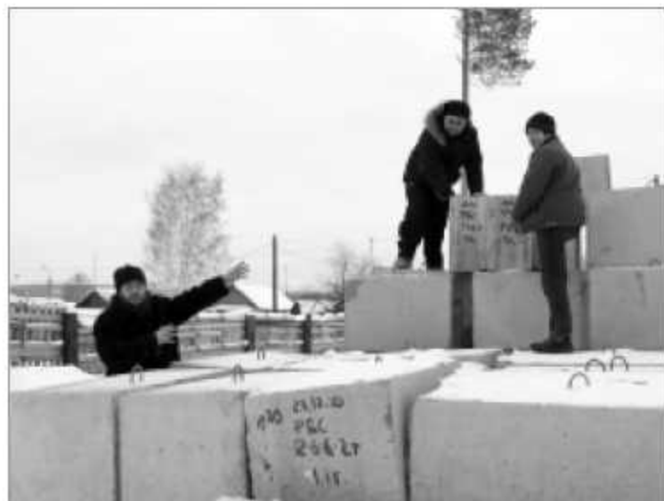
Эти железобетонные блоки станут фундаментом храма во имя Николая Чудотворца.