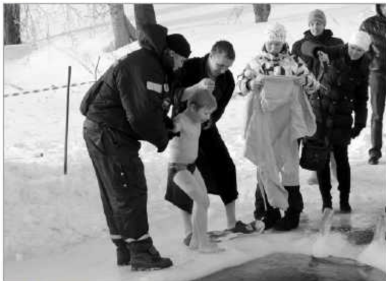
В прорубь окунались не только взрослые.

• Это безумные люди! Это кошунство! - возмущенно отзываясь о них отец Иаков. • То, что сделали эти люди, - огромный грех. Такое купание на пользу не пойдет. Окунайтесь в прорубь в Крещение надо перекрестясь и с молитвой.