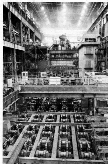
Машина непрерывного литья заготовки.

– Несомненно, как и нам был важен опыт коллег. Нашей главной опорой был Волжский трубный за-