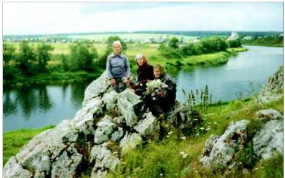
Слобода и сейчас одно из красивейших окрестностей Первоуральска.