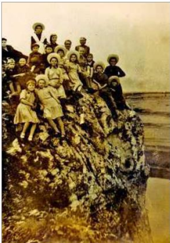
В Слободе в 50-е годы прошлого века.