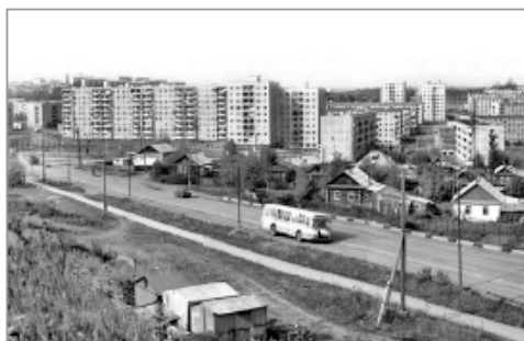
Так рос Первоуральск.