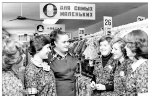
На открытии магазина по улице Малышева.