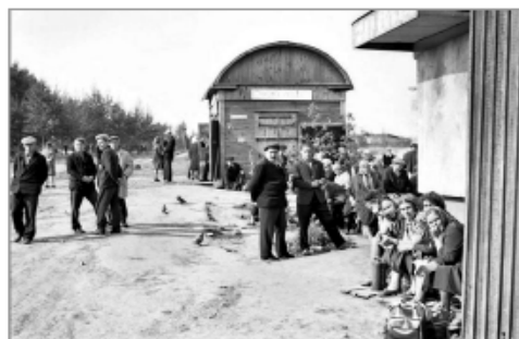
Та самая керосиновая будка.