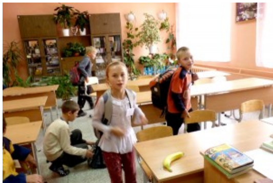
Дети с радостью приходят в обновлённые классы