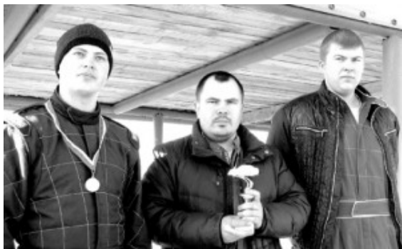
Команда МО Алапаевское

Во вторую субботу октября на автодроме посёлка Заря МО Алапаевское состоялись традиционные соревнования по автокроссу под названием «Золотая осень». В них приняли участие 27 спортсменов из Екатеринбурга, Арамиля, МО Алапаевское, Берёзовского, Режа, Верхней Салды, Ирбита, Камышлова.