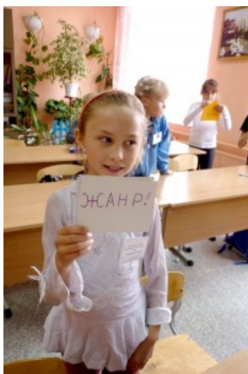
"Ребёнок по своей сути - живой моторчик"

- Наконец-то мы избавились от синей краски. У нас теперь только приятные оттенки. Апельсиновые, персиковые, вишнёвые, изумрудные. Дети на переменах могут посмотреть мультики. Репертуар — только советский. Старые добрые сказки. Аппаратуру музыкальную купили, микрофоны.