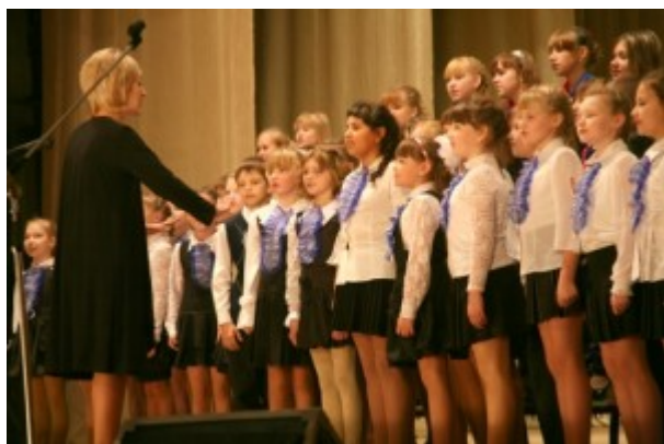
Вокально-хоровой коллектив школы №1 "Радуга"

Ничего нет прекраснее на свете, если дружат музыка и дети. Практически истина, прекрасная теорема, не требующая доказательств. В прошлую пятницу, 22 октября все, кто пришли в городской Дворец культуры стали свидетелями того, как хорошая музыка, а конкретно — хоровое пение, объединяет и детей, и взрослых, дарит как исполнителям, так и слушателям самые прекрасные чувства.