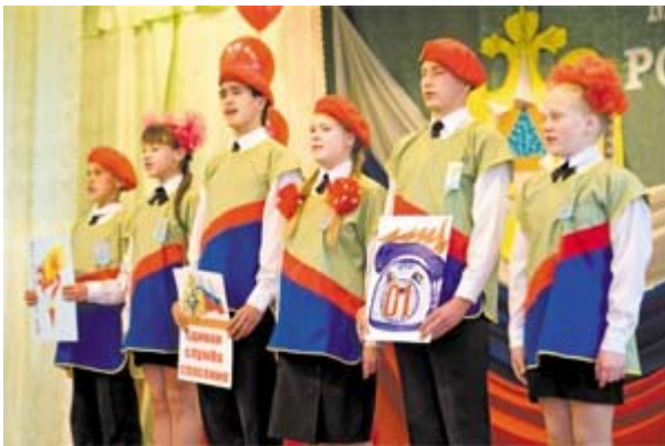
Команда юных пожарных Останинской СОШ