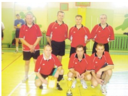
Команда ПЧ-76 - победитель соревнований

И вновь за окном ноябрь. Плюсовая температура на улице. В такую погоду приятно побывать на природе, просто побродить по городу, по парку, да и по ближайшему к дому лесу.