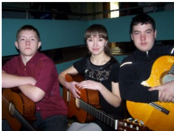
Группа "Медсанбат" из медицинского училища №3