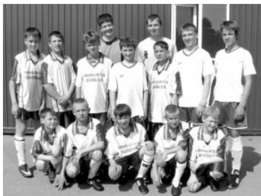
Команда МО Алапаевское