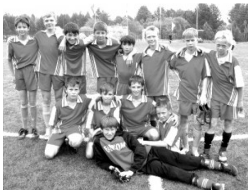
Команда МО город Алапаевск