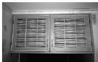
Кухонный шкаф из веточек ивы