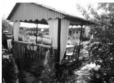
Немного фантазии и получилась беседка в саду