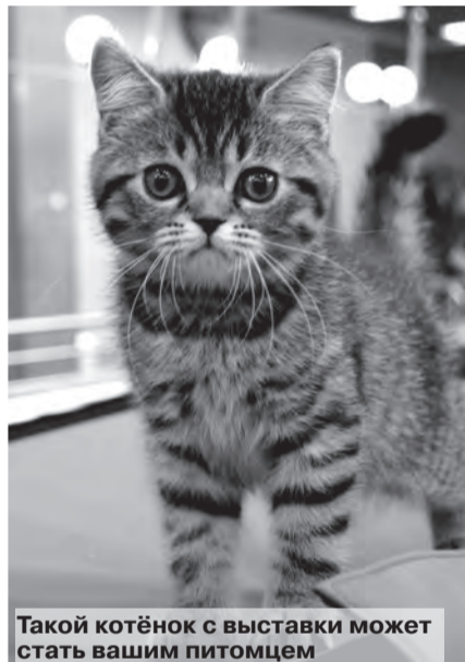
Такой котёнок с выставки может стать вашим питомцем