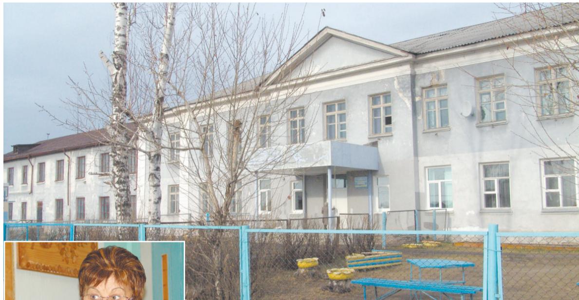
Верхнесинячихинская коррекционная школа-интернат

Губернатор Свердловской области сказал о том, что нужно поднимать рабочие специальности. А наши дети как раз-таки и идут на рабочие специальности,