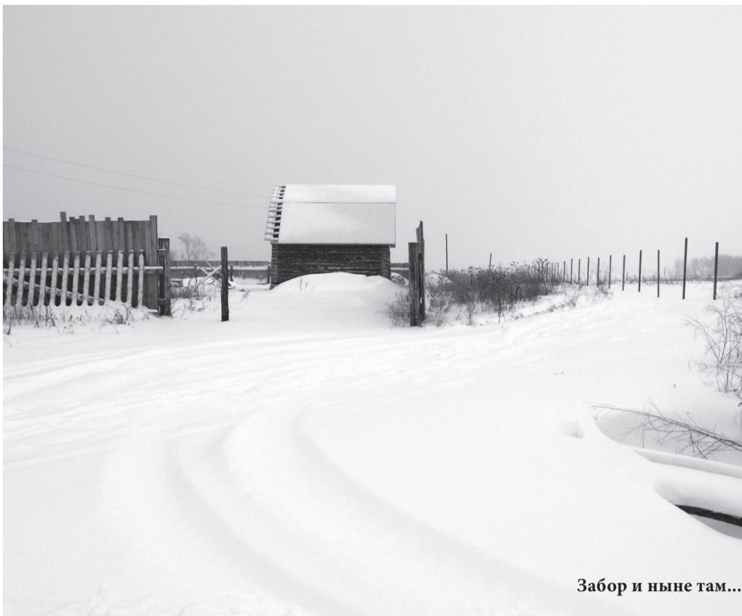
Забор и ныне там...