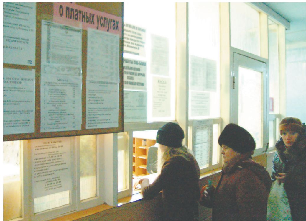
В очереди за талонами

Выяснив все в регистратуре, поднимаемся на второй этаж. Действительно, у кабинетов офтальмологов довольно много людей. Где-то на подходе встретился мужчина, который, видимо, уже завершил все переговоры с врачами.