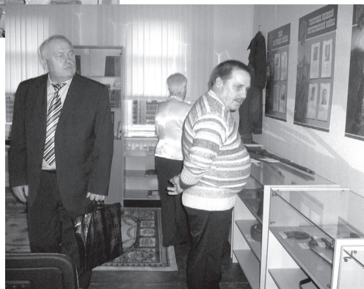
Сельские труженики в музее

В Год учителя музей Махнёвской школы существенно пополнился и обновился.