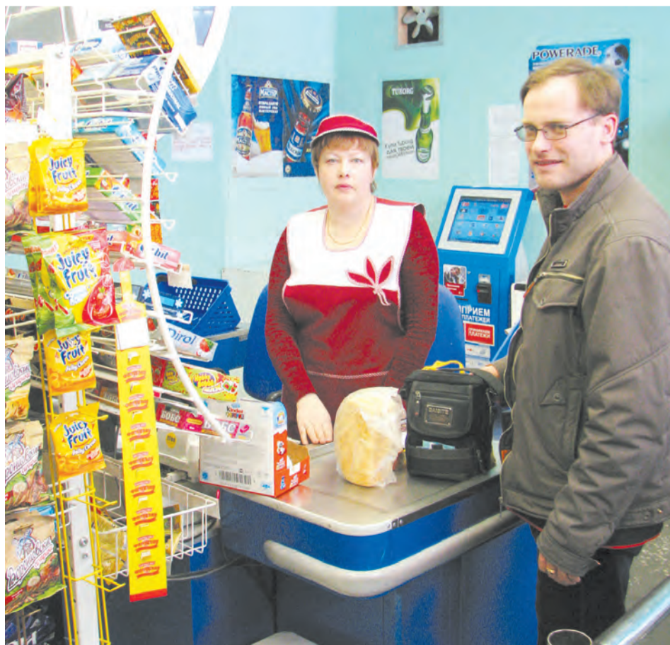
В магазине «Тритол-9»