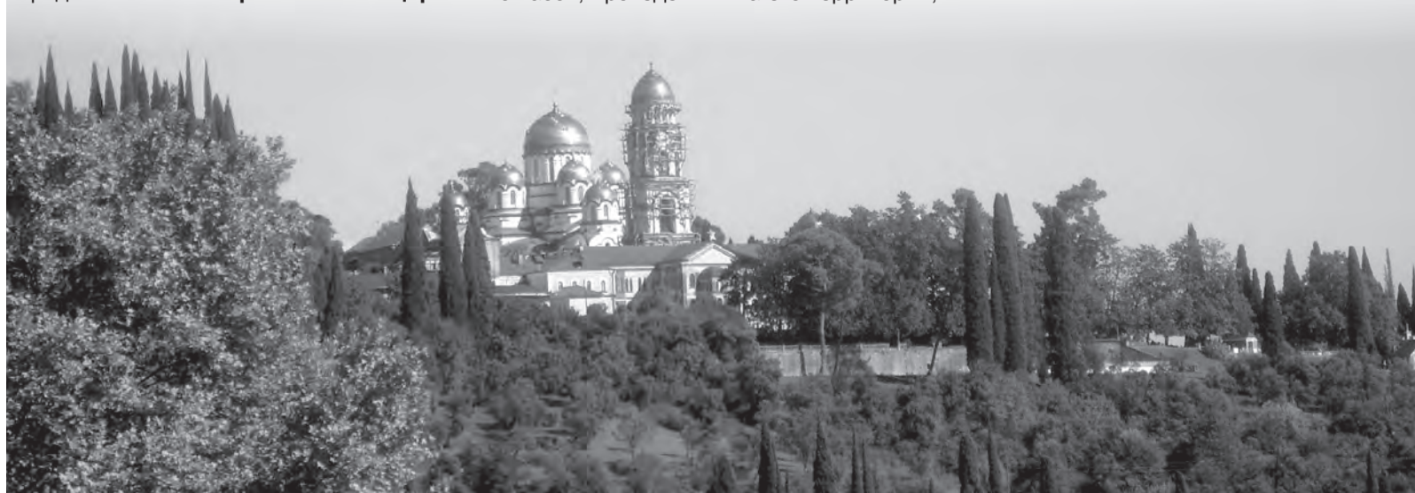
Новоафонский монастырь видно издалика

Е. БАЕВА, г. Алапаевск Фото из архива автора