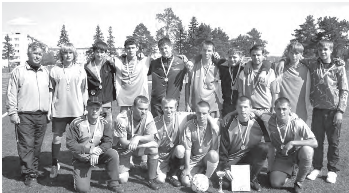
Команда «Орион» из В. Синячихи