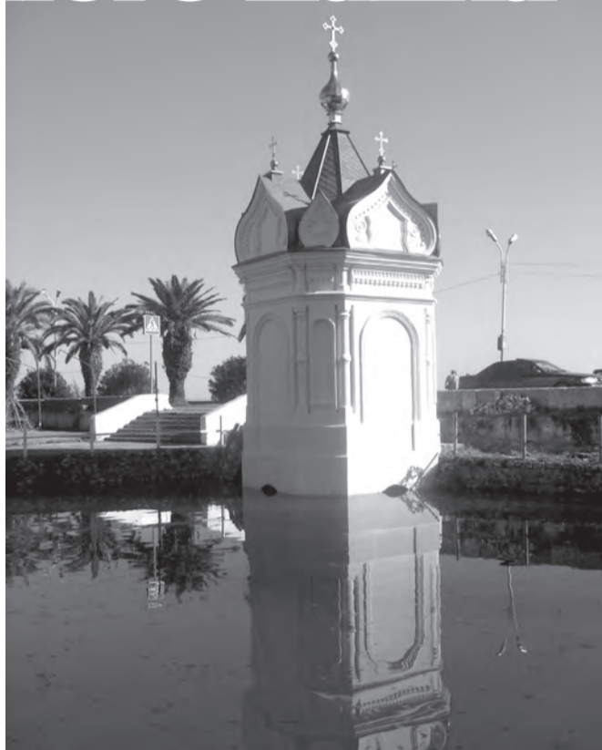
Часовня у пристани, поставлена на месте встречи императора Александра III

Я покидала монастырь , переполненная разными чувствами и мыслями: несколько часов, проведённых на его территории,