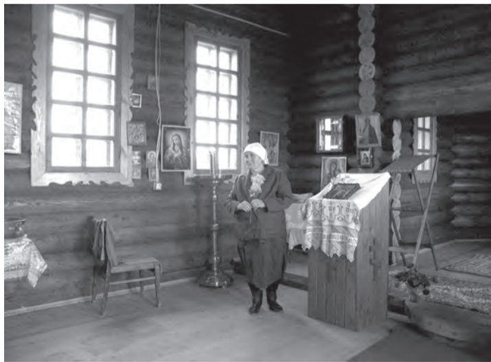
В Покровском храме ещё нет иконостаса

щих принять участие в православной благотворительной акции. И надеемся, что она найдет отклик в людских душах. Пусть же Господь поможет завершить задуманное, не остановит на полпути, даст силы к духовному возрожде-