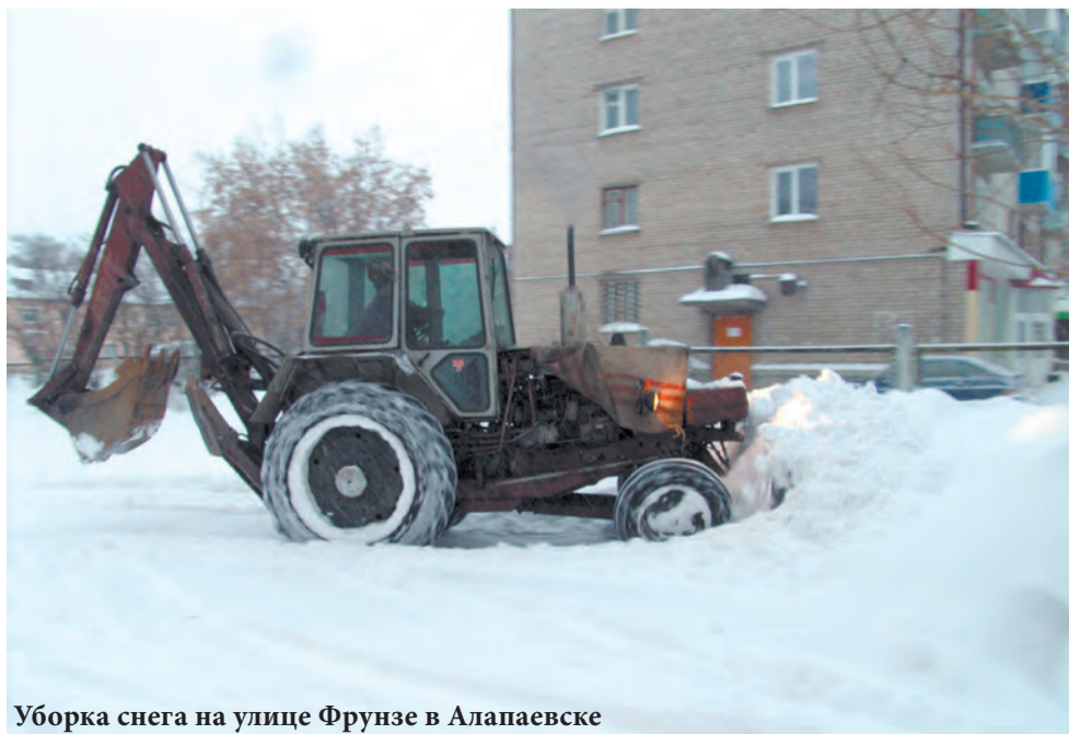
Уборка снега на улице Фрунзе в Алапаевске