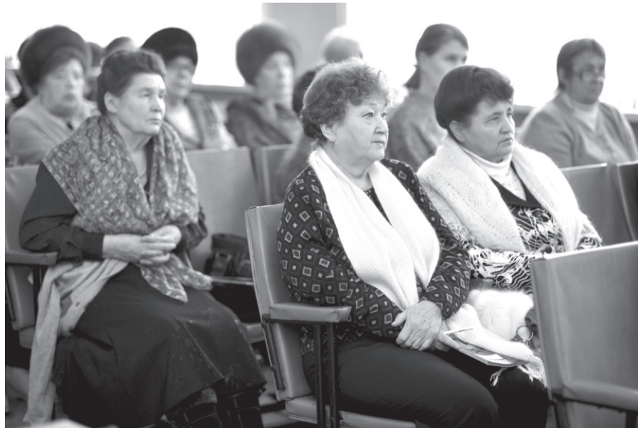
Участники отчетно-выборной конференции