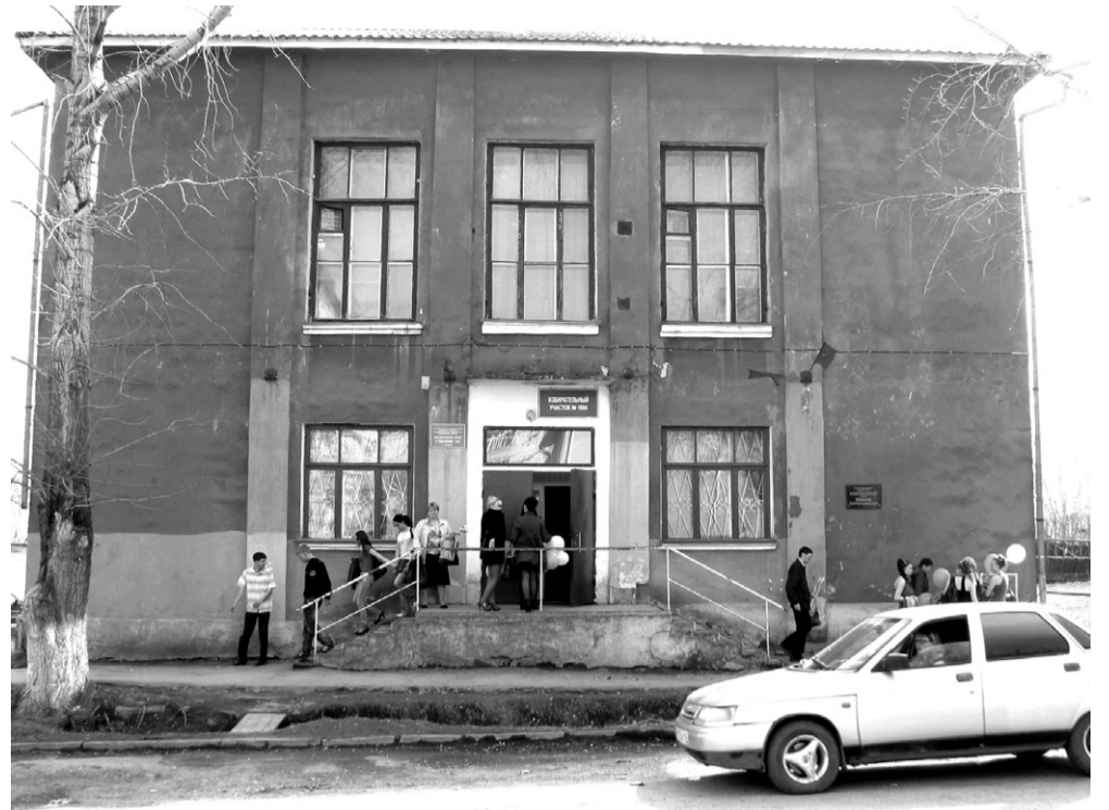
Здание медицинского училища № 3

Сегодня медицинское училище продолжает готовить специалистов по нескольким уровням подготовки. Решая задачу модернизации сестринского образования, коллектив училища определил