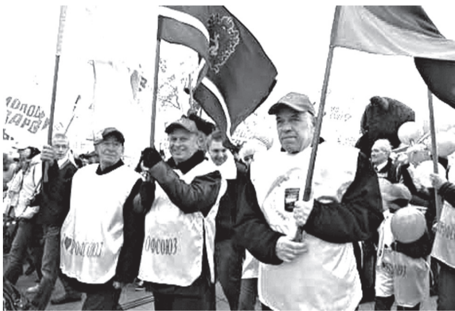
Профсоюзы всегда на защите прав трудящихся

торым МРОТ должен приравниваться к прожиточному минимуму, стали реалиями нашей жизни. Кроме того, профсоюзы настаивали на начислении уральского коэффициента на минимальный размер оплаты труда. В суд обратились работники дошкольных образовательных учреждений, которые получали заработную плату в размере 4330 рублей. По результатам судебных решений им была выплачена недоначисленная и недовыплаченная зарплата. Решением Думы МО город Алапаевск от 14 декабря 2010 года предписано начисление уральского коэффициента в размере 15 процентов на 4330 рублей для работников образовательных учреждений. Но пока не решён вопрос в этом плане по медицинским работникам и работникам культуры. Этот вопрос взят на рассмотрение Думой МО Алапаевское.