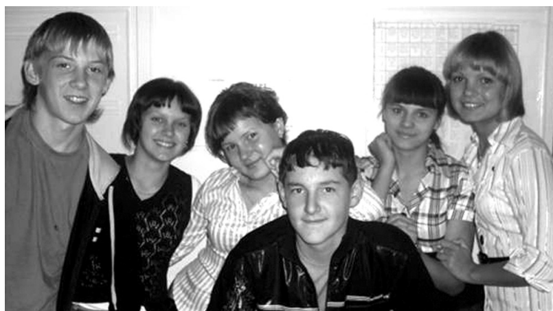
Учащиеся Голубковской СОШ

Школа, школа... Сколько же времени и сил она требует! Нередко мы, учителя, делимся друг с другом впечатлениями о своих учениках: «Как же так, он совсем не учится?!», «Он мешает всем ребятам работать...», «Этот двоечник из 7 «б» опять пришёл без учебника!».