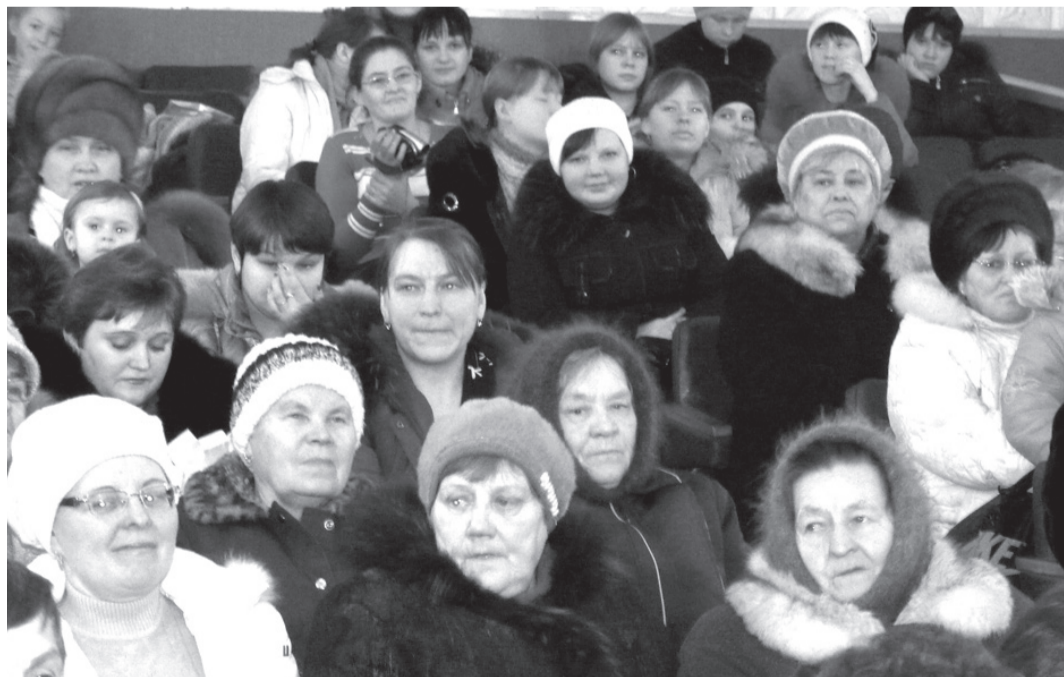
На юбилейный концерт, посвященный 25-летию детсада «Светлячок», пришло едва ли не все Голубковское

муниципального образования, здесь проблема нехватки мест в детском саду не так остра, но если существует возможность проблему устранить совсем, то почему бы это не сделать? Решено — сделано! В минувшем году силами сотрудников детсада и за счет средств местного бюджета была проделана колоссальная работа по ремонту пустующих помещений и размещению в них дополнительной группы для самых маленьких очередников. В этом году садик прошел процедуру лицензирования и получил довольно высокую оценку лицензионной комиссии. Уже 1 сентября 2011 года новая дополнительная группа примет своих воспитанников и начнет работу. Получается, нынешний юбилей — дата знаковая, поскольку знаменует собой очень добрый знак: в Голубковском есть дети, а это значит, что у села есть будущее.