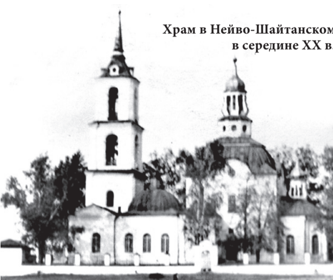
Храм в Нейво-Шайтанском в середине XX в.

А. ВОЛИНА, п. Н.-Шайтанский