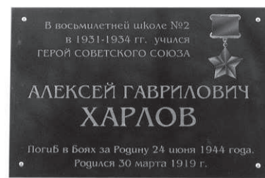
Памяти Героя будем достойны

В Алапаевске живут родные и близкие героя, поэто-