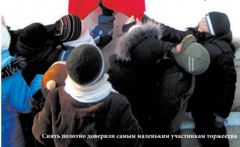
Снять полотно доверили самым маленьким участникам торжества