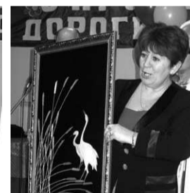
Открытие клуба в селе Толмачёво