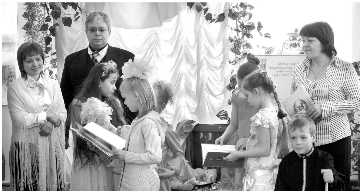
В Гессенском замке. Подарки на Рождество