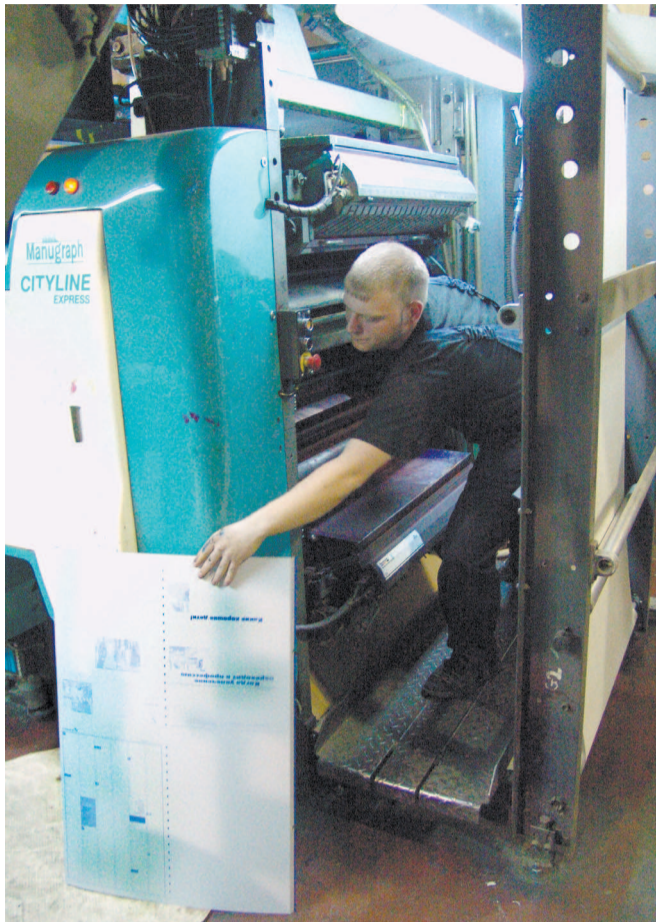
В Режевской типографии «Циркон» готовится к печати очередной номер «Алапаевской искры»

Все это цифры, которые, конечно, отражают действительность, но, как говорится, с мест все видится иначе. Вы, дорогой читатель, конечно, в курсе, что минувший год был для «Алапаевской искры» юбилейный — 90 лет со дня выхода первого номера газеты. Сама неумолимая логика истории минувших десятилетий свидетельствует, что наша газета была другом и товарищем для жителей города и района в самых трудных и страшных испы-