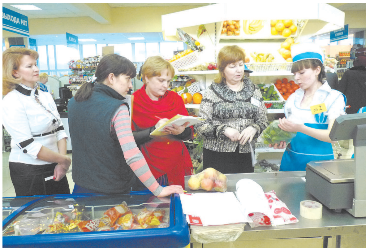
Практический этап конкурса продавцов проходил в магазине «Сотка»

Олег КОСТРОМИН Фото автора и О. ЛЕПЁШКИНОЙ