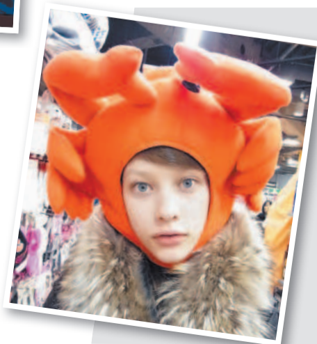
В огромном магазине я наткнулась на шапку в виде краба. Не удержалась и примерила ее. А потом не удержалась и сфотографировалась в ней.