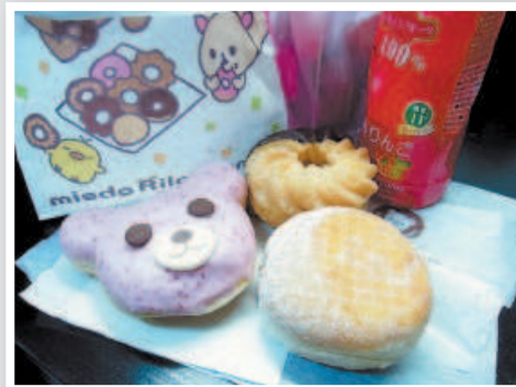
Однажды перед съёмкой мой стилист завёл меня в магазин пончиков и купил мне целый пакет. Пончики были очень красивыми и безумно вкусными — пальчики оближешь.