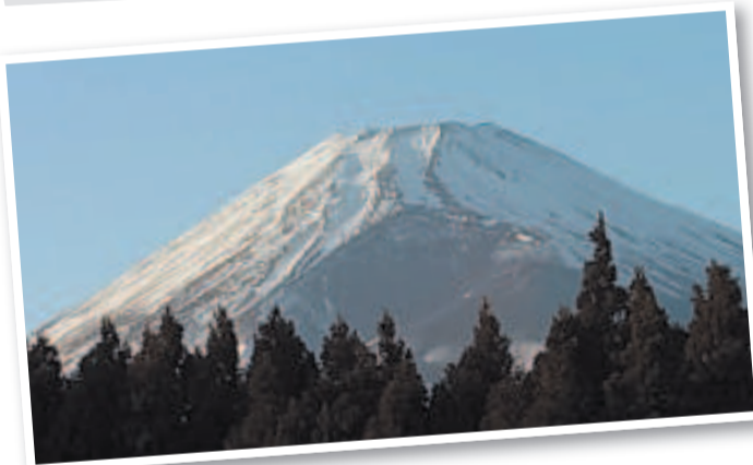
Одна из натуральных съёмок происходила у подножия Фудзи. Сфотографировать главную достопримечательность Японии - вулкан Фудзияма (в европейской транскрипции) нужно обязательно.