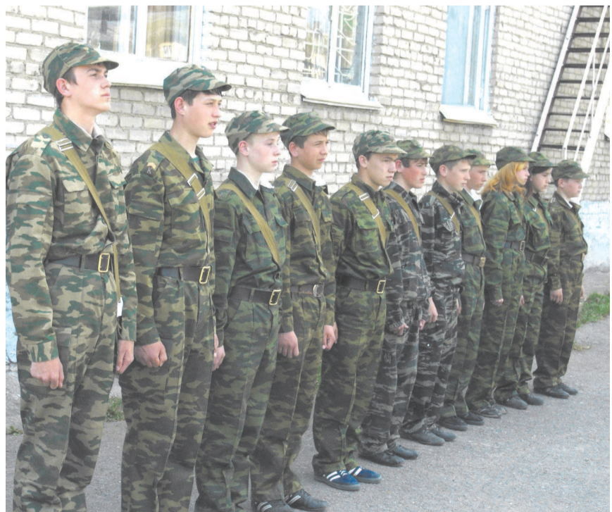
Воспитанники военно-патриотического клуба «Звезда»