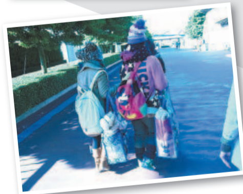
На этом снимке совершенно взрослые люди, а кажется впали в детство. На мой взгляд, это любимый стиль одежды японцев.