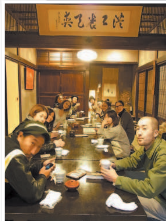
Обед со съёмочной группой в национальном ресторанчике за городом тоже яркое событие.