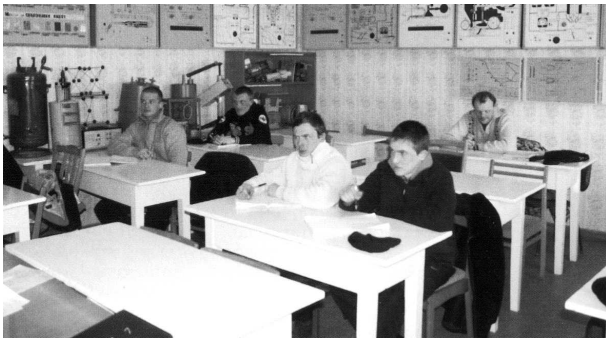
Профессиональное обучение работников

ключается в финансировании затрат в размере не более 120045,5 рубля за одно рабочее место на приобретение, монтаж и установку основного и вспомогательного оборудования (специального программного обеспечения), мебели для оснащения вновь созданного или существующего вакантного рабочего места для трудоустройства незанятого инвалида, изменение отдельных элементов интерьера в соответствии со специальными требованиями к организации труда инвалидов с поражением отдельных функций и систем организма санитарных правил СП 2.2.9.2510-09 «Гигиенические требования к условиям труда инвалидов», утвержденных постановлением Главного государственного санитарного врача Российской Федерации от 18.05.2009 г. № 30 «Об утверждении СП 2.2.9.2510-09», проведение аттестации по условиям труда созданного специального рабочего места для трудоустройства незанятого инвалида, оплату труда инвалидов.