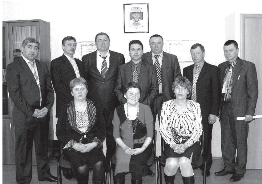
Депутаты Думы Махнёвского МО второго созыва.

Внесены изменения в Программу социально-экономического развития Махнёвского МО на 2009-2011 годы: в сфере образования - реализация мероприятий по привязке к местности типового проекта на строительство детского сада в п.г.т. Махнёво на 135