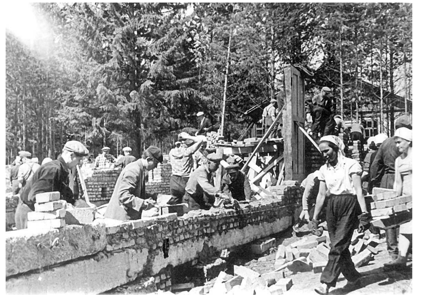
Комсомольский субботник на строительстве корпуса в пионерском лагере «Факел», 1966 г.