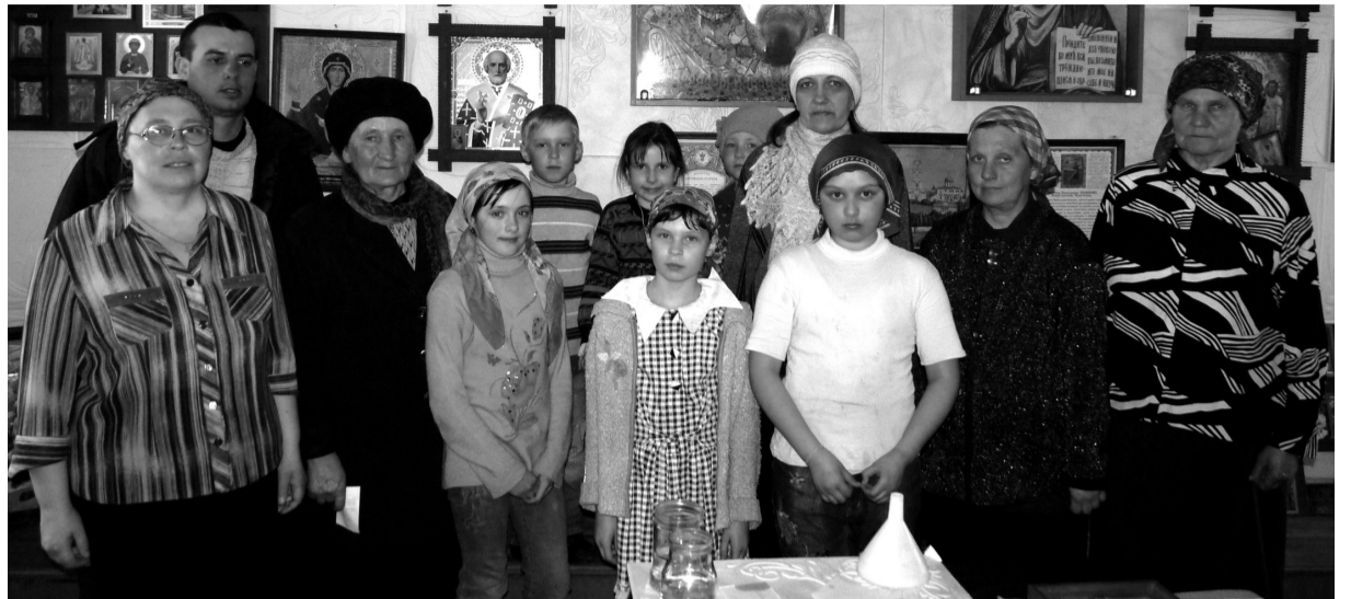
В Ясашинском православном приходе собираются все — и стар, и млад.

Общепоселковые праздники всегда проходят в клубе. Правда, и школа регулярно организует утренники и концерты (например, провели праздник, посвящённый Дню космонавтики). В клубе селяне, в основном, собираются по всем значимым календарным датам — Новый год