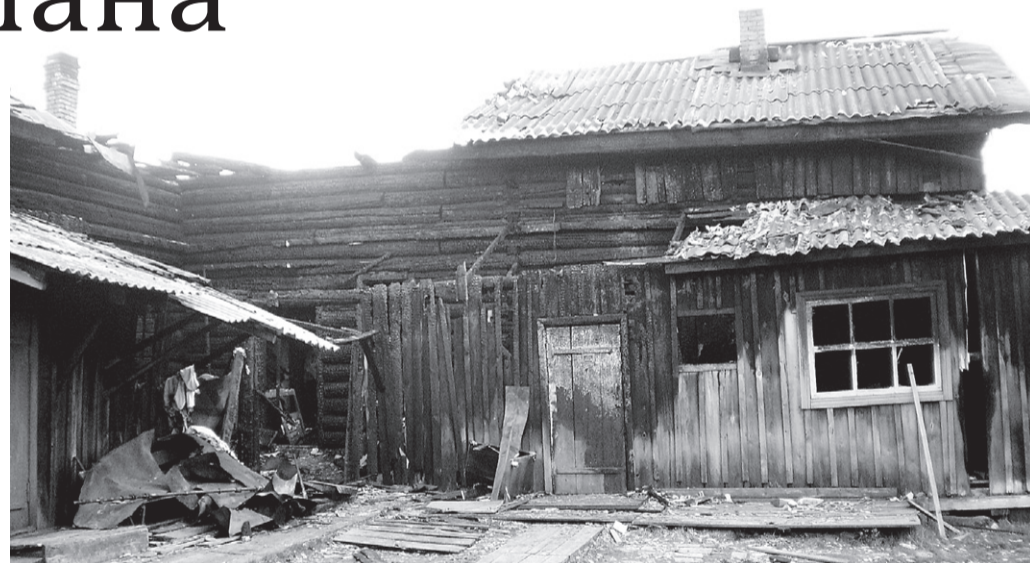
Пострадавший от пожара дом на ул. Лесников, 13

Последний пожар произошел в Рабочем городке на улице Монтажник. Подозрения в поджоге падают на подростков 2000 года рождения.