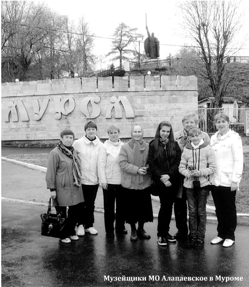
Музейщики МО Алапаевское в Муроме