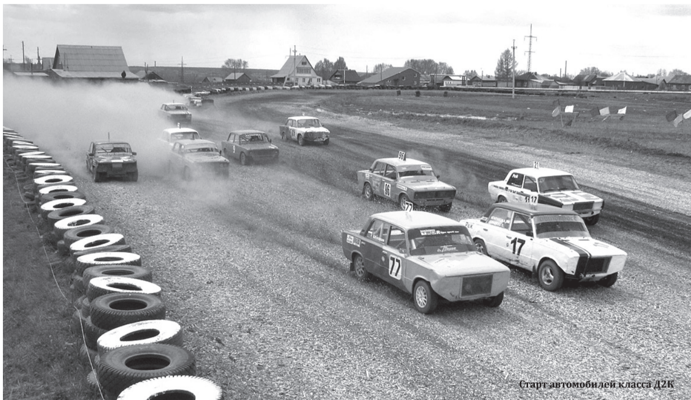
Старт автомобилей класса Д2К