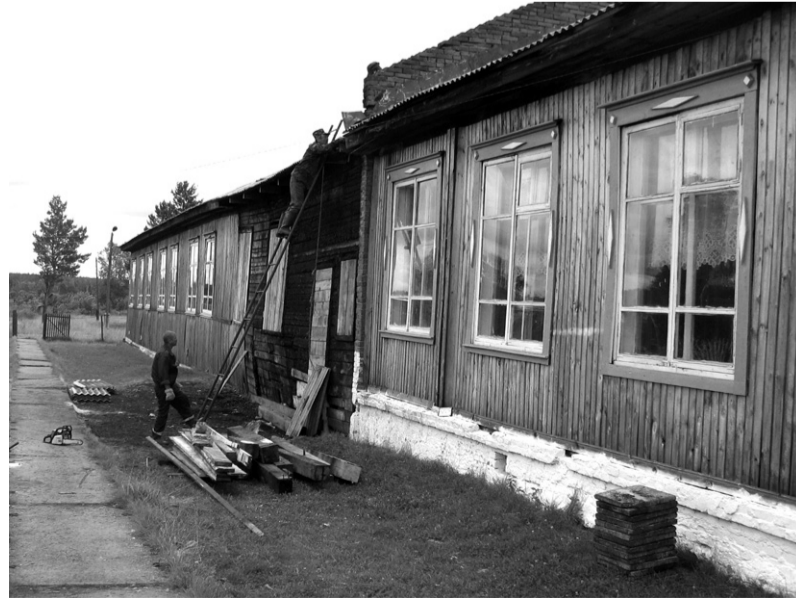
Пострадавшая от пожара школа