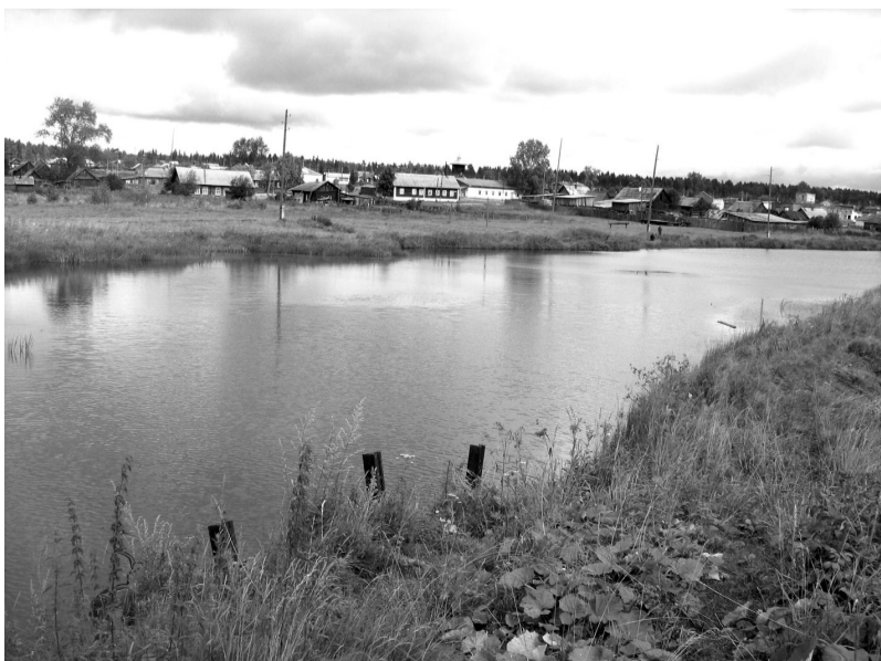
Вид на поселок Ясашная