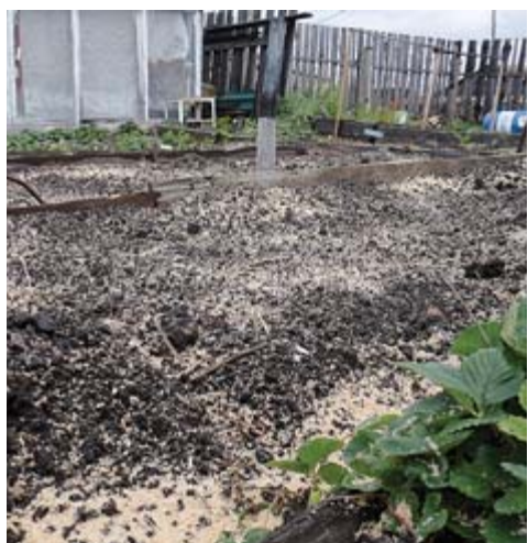
■ Грядки с озимыми посадками

- Про чеснок не скажу, уже не помню. Лук-севок покупаю каждый год в «Фермере», как и все семена. А морковь у меня сортов «нантская» и «балтимор», причём и оранжевая, и жёлтая. Жёлтую выращиваю специально для приготовления плова и ухи.