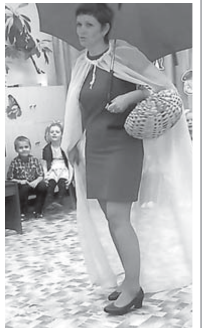
Сценка для бабушек