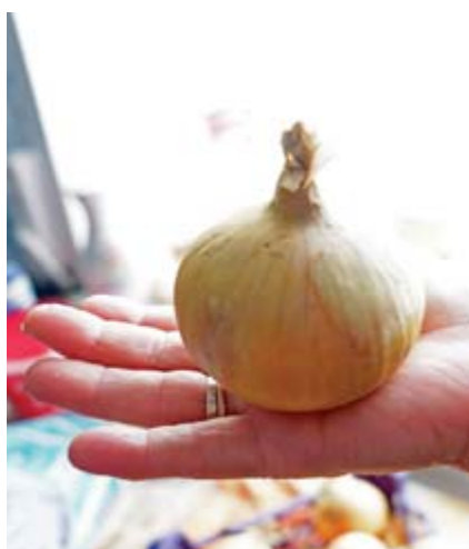
■ Вот такой вырастает сеянец