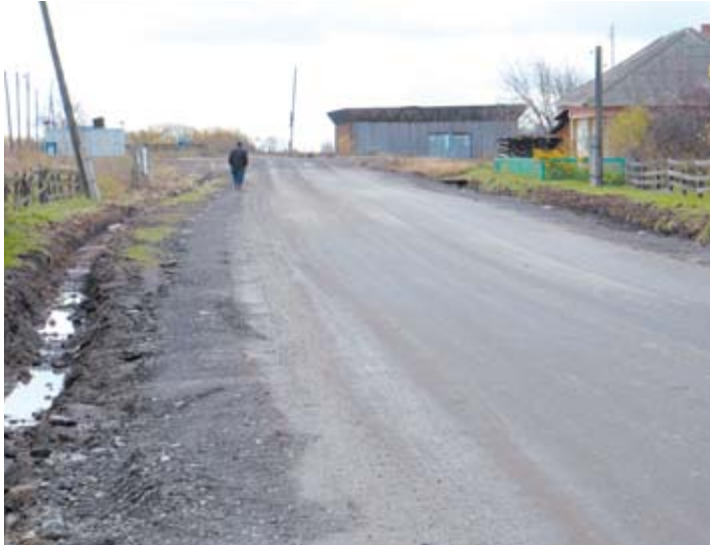
Новая дорога в с. Невьянском по ул. Свердлова