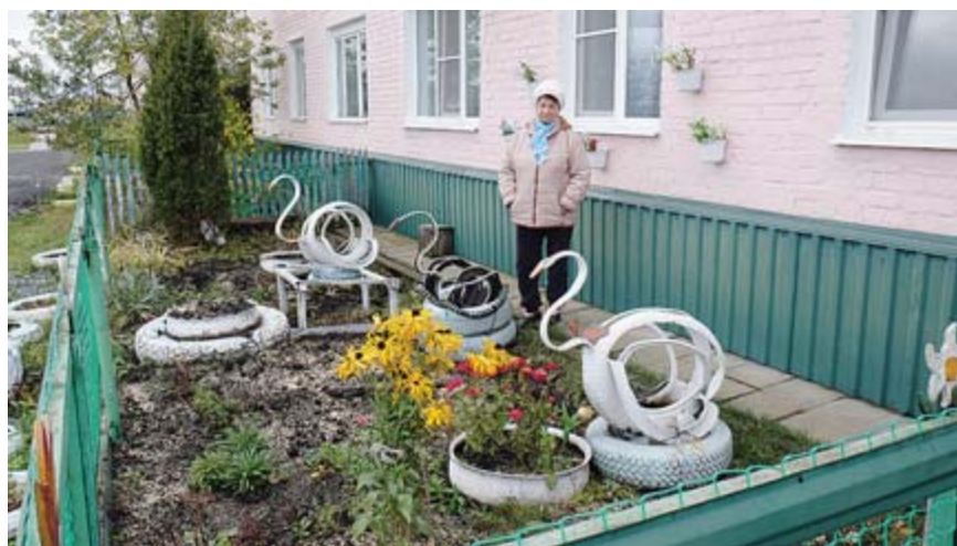
■ Палисадник у многоквартирного дома