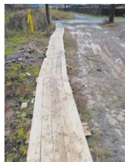
По новому тротуару и ходить безопаснее