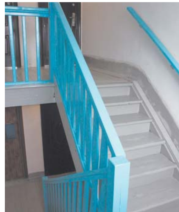
Обновлённый третий подъезд дома

падню из досок, за которой находится узел сантехники. По словам жильцов, рабочие к ремонту подошли очень ответственно и после себя всё вымыли, вплоть до окна.