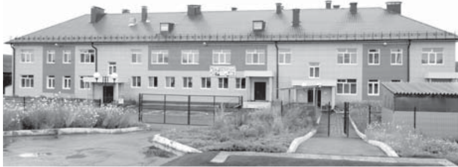
Новый детский сад