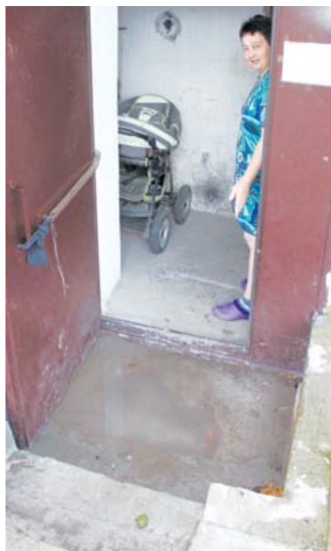
Жителям первого и второго подъездов приходится ходить по лужам