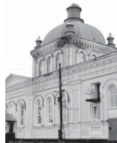
Фасад дома культуры нуждается в ремонте