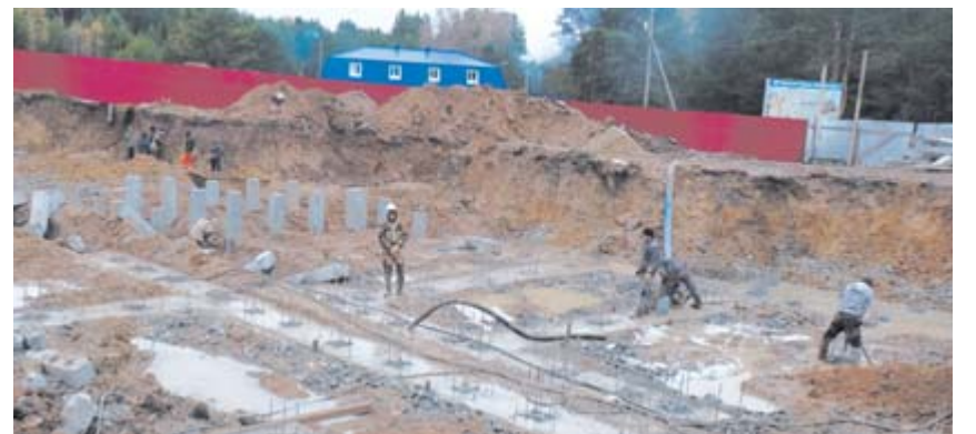
Здесь будет новый дом на 59 квартир