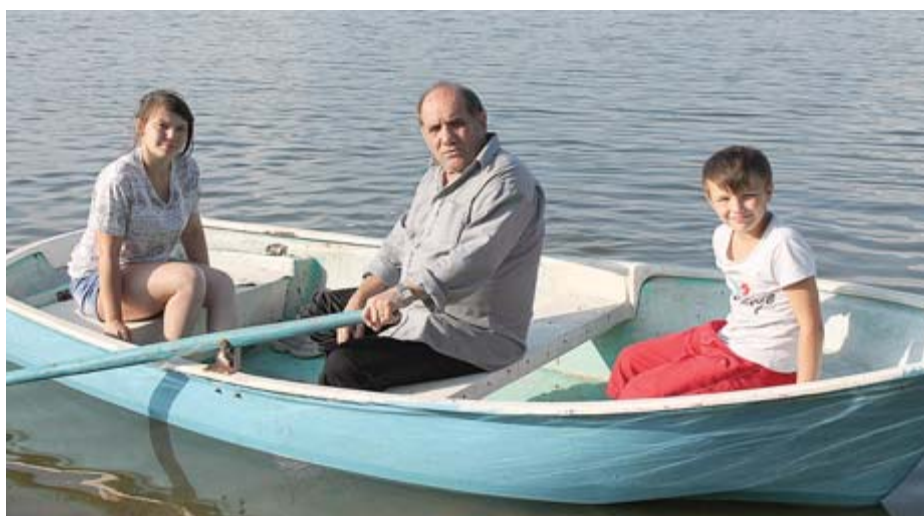
В этом году наша семья съездила на озеро Сладкое