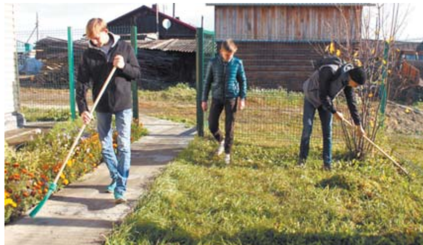
Волонтеры на субботнике у сельского ФАПу

родской больницы, при проведении УЗИ у одного из пациентов были выявлены изменения, потребовавшие экстренной госпитализации, - острая задержка мочи. Таким образом жизнеугрожающие осложнения были предупреждены.