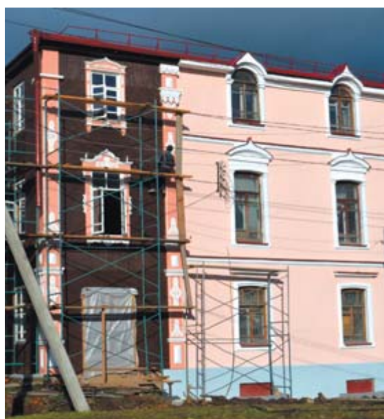
Работы по реконструкции ещё очень много

Продолжается реконструкция краеведческого музея города Алапаевска, расположенного по улице Ленина.