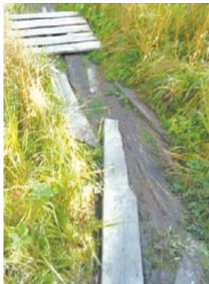
Так дорожка выглядела раньше

Прошло много лет как я уехала из посёлка Верхняя Синячиха, но регулярно приезжаю в гости к маме и другим родственникам. И долгое время сталкивалась с тем, что путь к дому, где живёт моя мама, был непроходимым для пешеходов.