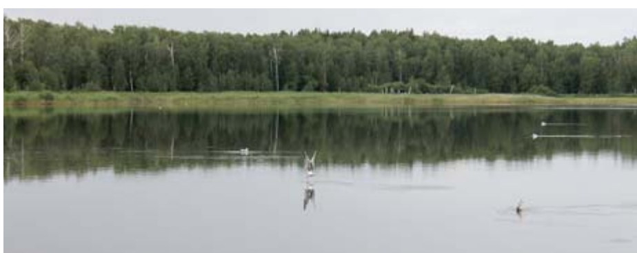
Незабываемый отдых в Челябинской области