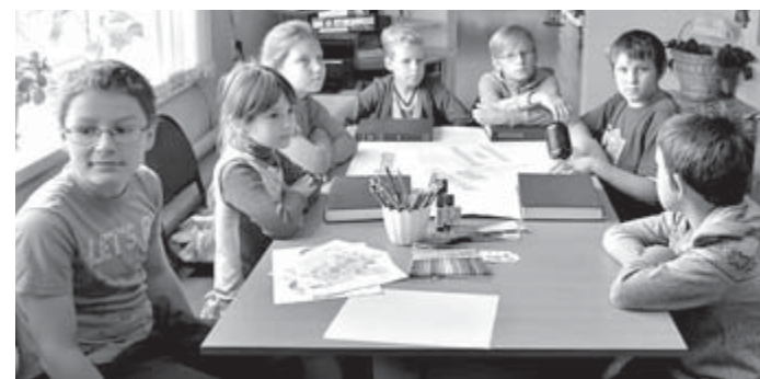
За выпуском стенгазеты

Несмотря на каникулы, дети с удовольствием посещали мероприятия, с интересом читали книги, знакомились с журналами, играли в настольные игры. Многие читатели приходили в библиотеку со списками литературы для внеклассного чтения.