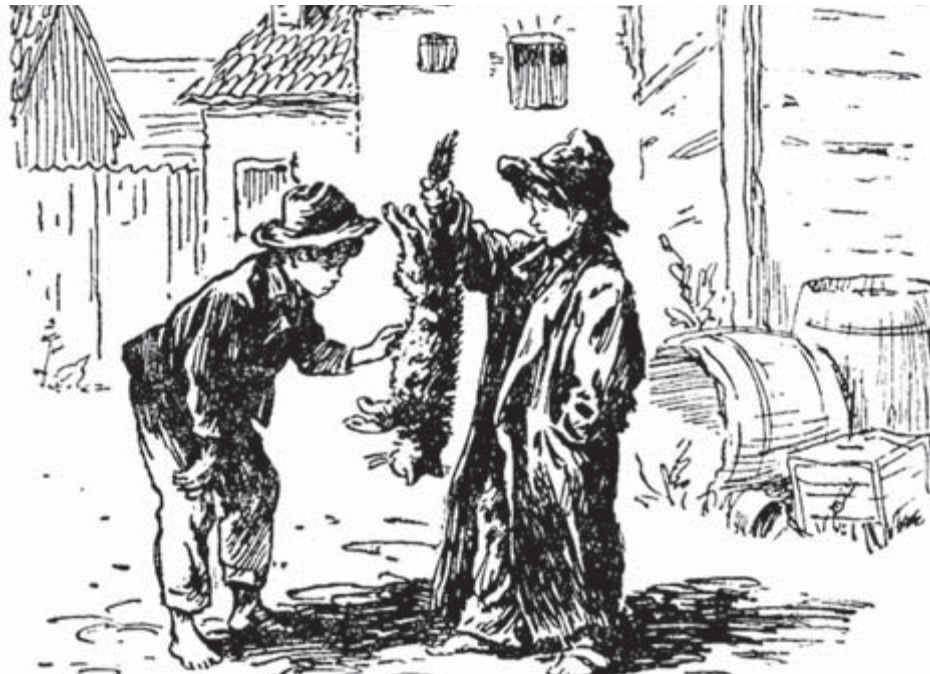
Том Сойер и Гекльберри Финн Марка Твена

Радость радостью, а участники рейда уже интересовались, как дети готовы к школе, все ли малыши посещают детский сад... Занимали нас и другие вопросы, в том числе и о том, какая требуется помощь.