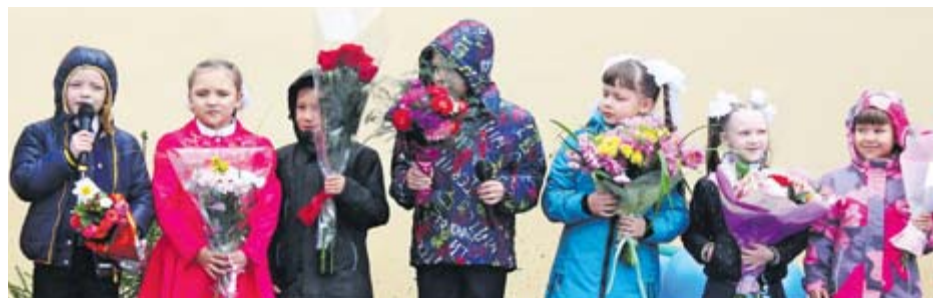
Учащиеся начальных классов школы №1

Светлана НИКОНОВА