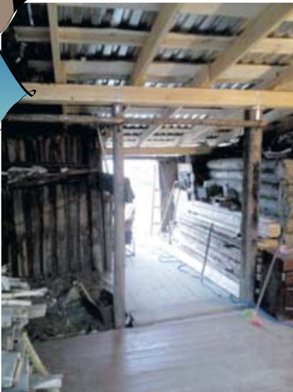
■ Как было

Светлана НИКОНОВА