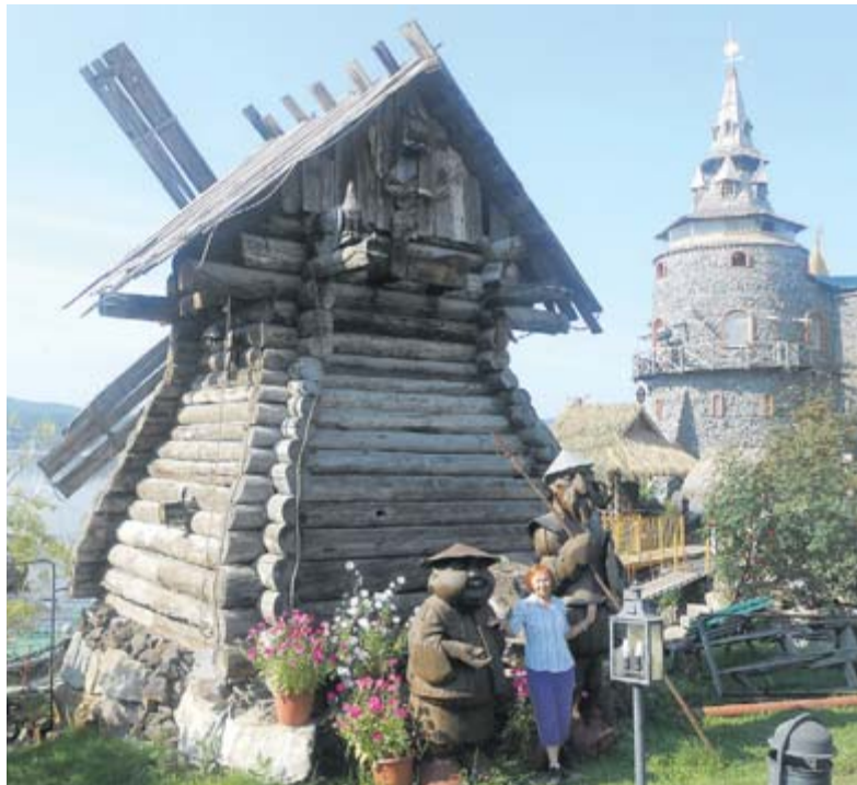
Дон Кихот и Санчо Панса у ветряной мельницы

В этих же местах открыли месторождение кварца, и рудник перешёл на его добычу. Но в настоящее время производство очень ограничено, хотя спрос на продукцию имеется. Кварц применяется в электротехнической, космической и других отраслях.