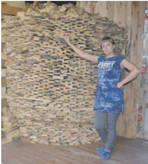
■ Как стало