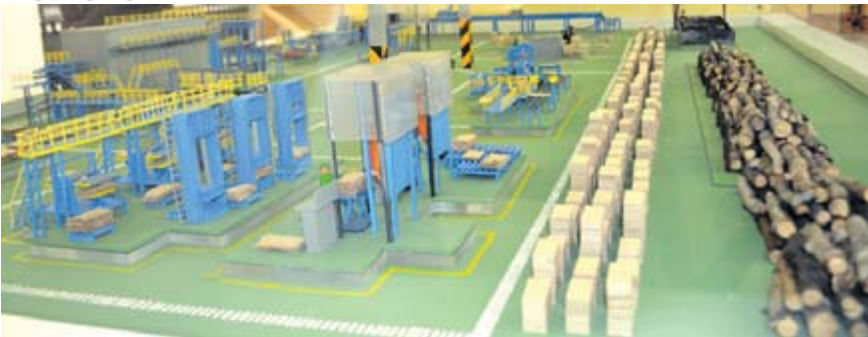
Интерактивный макет фанерного производства в музее