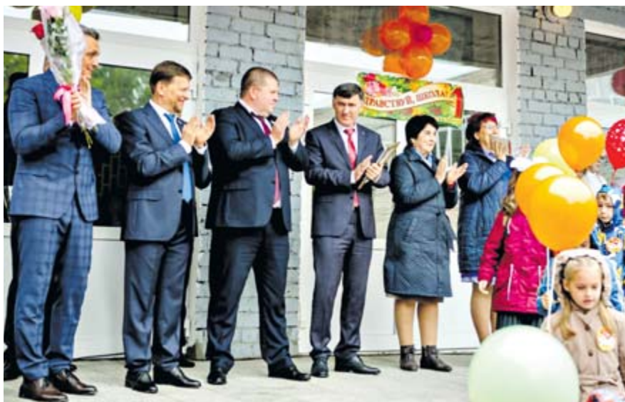
Высокие гости на линейке в школе №4