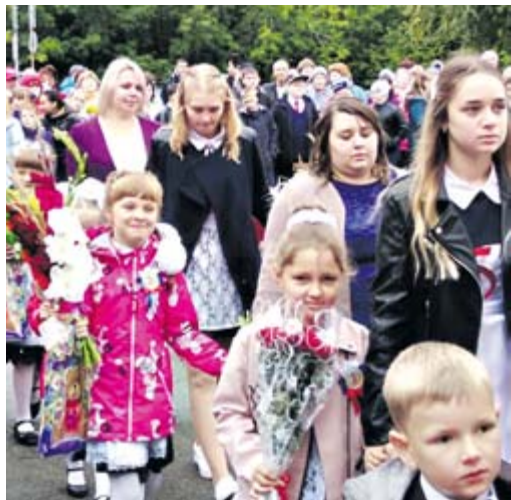
На линейке в Коптеловской школе

День знаний – главный праздник в школе, и готовятся к нему особенно тщательно. В этот день много цветов и улыбок, радостных встреч и пожеланий, стихов и музыки... Особенно волнителен этот день для первоклассников – для них только распахнулись двери в бескрайнюю и удивительную страну знаний.