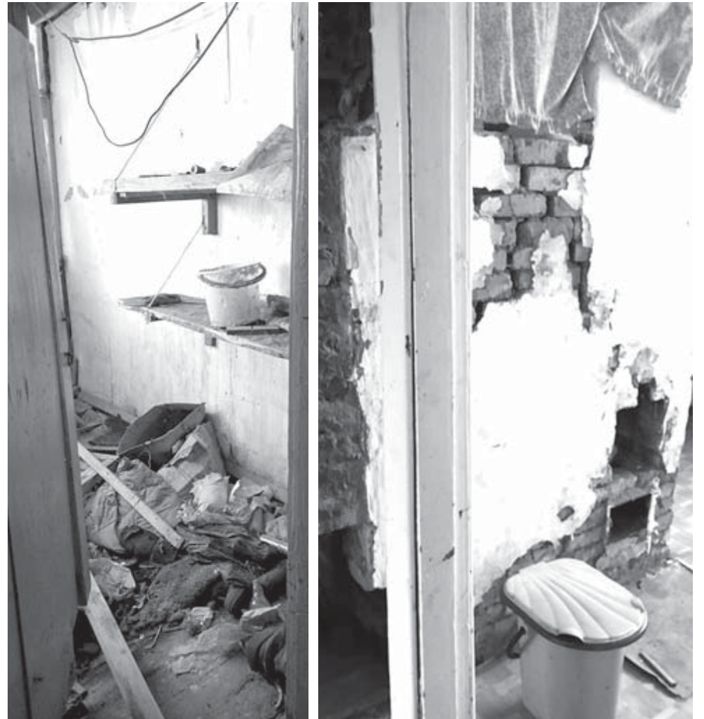
Такую картину мы застали в доме, где живет семья с четырьмя детьми

то одобряющий взгляд матери, старший сын воскликнул: