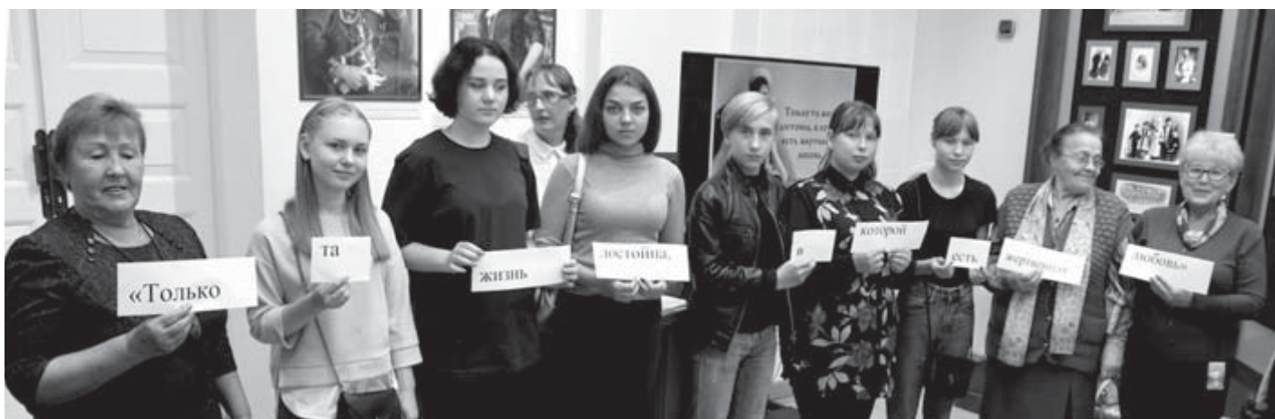
Тематическая игра вызвала большой интерес участников разного возраста

Выставка-продажа ювелирных изделий и сувениров местных мастеров. Заявки по телефону 8-952-726-71-20.