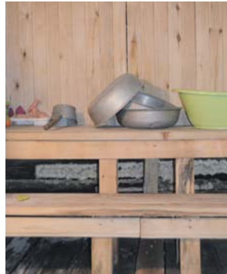
■ Банный пол, сделанный Оксаной