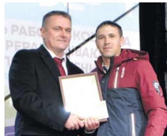
На празднике было награждено более 150 лучших сотрудников

И, наконец, праздник! «Свеза» совместно с администрацией Верхней Синячихи организовала праздничные мероприятия для жителей поселка и сотрудников комбината и их семей. Во время торжественной части были награждены грамотами более 150 лучших сотрудников. Компания не забыла и о самых маленьких гостях: специально для детей была организована обширная развлекательная программа, которая включала в себя аттракционы и зрелищное цирковое шоу. Директор комбината поздравил будущих первоклассников, детей сотрудников комбината, и вручил им сертификаты на покупку канцтоваров. Затем последовала насыщенная концертная программа и фейерверк.