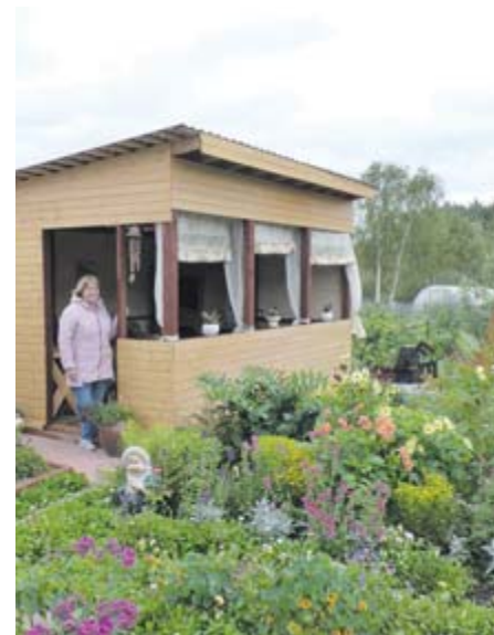
■ На улице осень, а в саду продолжается лето