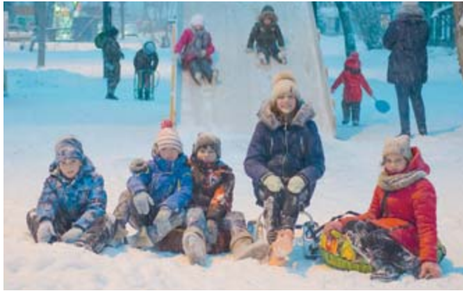
«Когда мои друзья со мной». Автор Евгений Котлов, г. Алапаевск

Необходимо заполнить заявку, в которой указать название работы, фамилию, имя, отчество автора, возраст, номер контактного телефона.