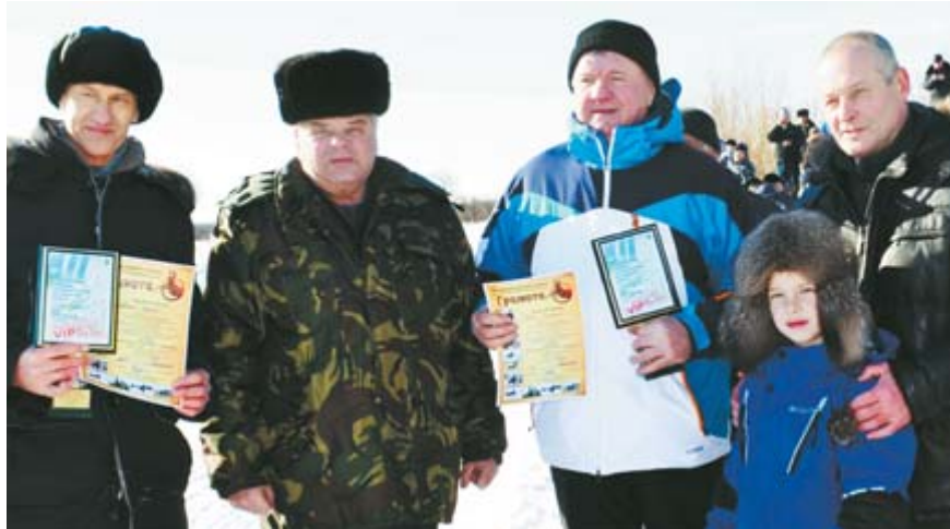
Награждение почётных гостей

– От всей души я хочу поздравить вас с тем, что вы сохранили традицию проведения на своей земле конно-спортивных соревнований. На самом деле она мало где сохранилась. Это заслуга в первую очередь всех тех, кто приложил к ней руку, душу, серд-