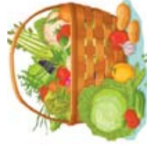
По материалам СМИ

10 марта (вс) ● Благоприятный день для посадки однолетних и многолетних цветов. ● Замачивание и прорациивание семян, посев на рассадку огурцов, скороспелых томатов, перца, баклажанов, разных видов капусты. ● Посев редиса, зеленных, салата, минеральной подкормка, полив. ● Формирующая обрезка, заготовка черенков для прививки. Прививка и перепрививка деревьев. Лечение ран, побелка стволов. ● Заготовки — соление и квашение капусты. ● Не рекомендуется пересадка, пикировка, рыхление в зоне корней.