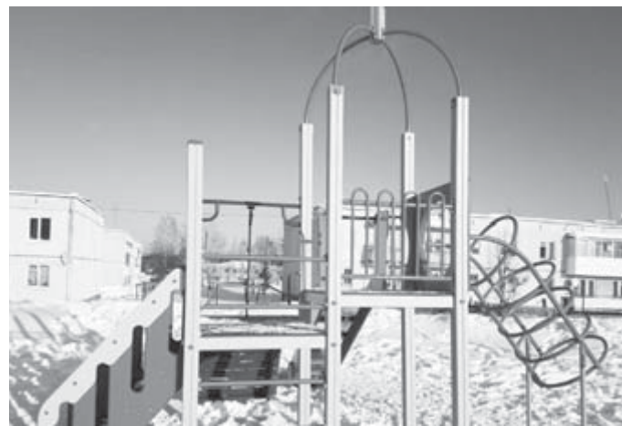
Детская площадка в Бубчиково

Л. ТИМЕРОВА, Л. СЕРОВА, Е. КРИВОНОВОВА, п. Бубчиково