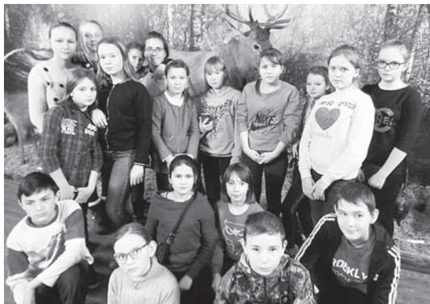
Снимок на память

Нам предстояло испытать еще большее удивление в зале «Животный мир». Войдя в зал и увидев чу-