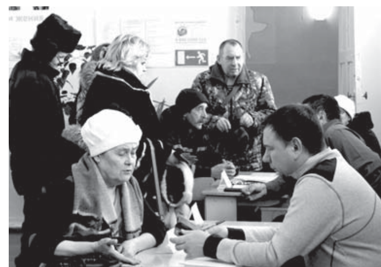
На все вопросы были получены разъяснения