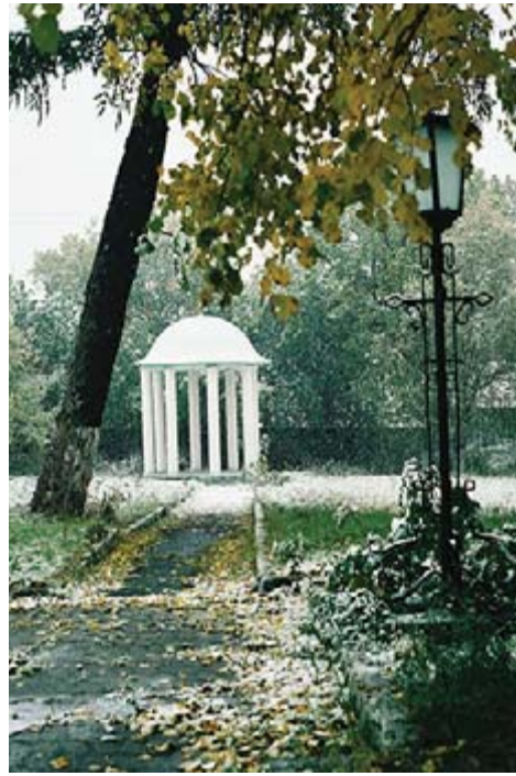
«Сентябрьская зима». Автор Игорь Заложнев, г. Алапаевск