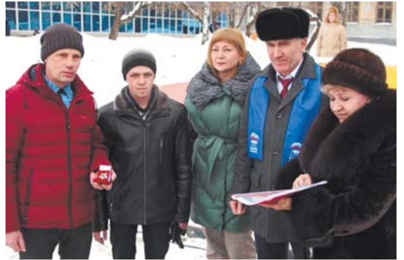
Торжественная передача награды