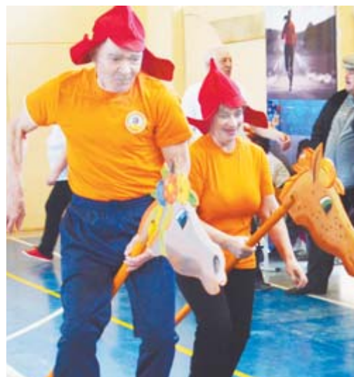
Конкурс «Наездники» оказался самым интересным и весёлым

Организаторы спартакиады – управление физической культуры, спорта и молодёжной политики и совет ветеранов.