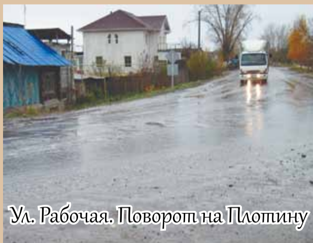
Ул. Рабочая. Поворот на Плотину