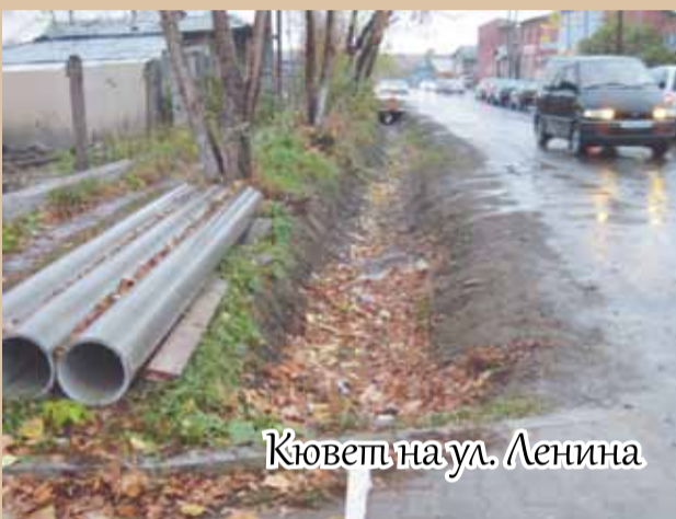
Кювет на ул. Ленина