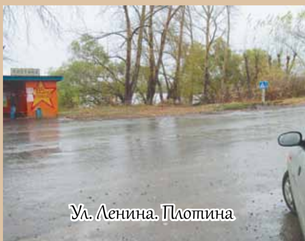
Ул. Ленина. Плотина

На содержание и ремонт дорог Арамильского городского округа в бюджете АГО на 2010 год было запланировано 2 миллиона 252 тысячи рублей. На сегодня заключено договоров на выполнение ремонтно-строительных дорожных работ на сумму 1 миллион 954 тысячи рублей. Оставшуюся сумму - более 380-ти тысяч рублей планируется потратить на «развитие транспортного комплекса» - на установку дорожных знаков, нанесение разметки и т.п. На следующий 2011 год Службой заказчика подготовлена заявка на финансирование по статье «содержание и ремонт дорог» на сумму 5 миллионов 415 тысяч рублей.