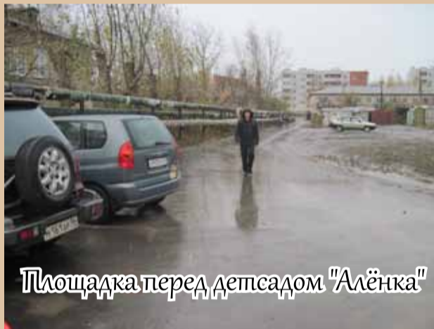
Площадка перед детсадом "Алёнка"