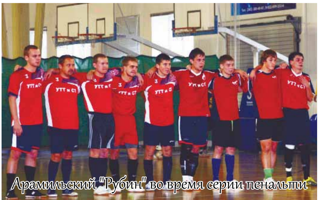
Арамилльский «Рубин» во время серии пенальти

ка, а только лишь огромное желание выиграть. Самым напряженным получилось противостояние одиннадцатиклассников четвертой и первой школы, исход которого решил точный трехочковый бросок, забитый за мгновение до конца игры. Победу в этом случае праздновали ребята из школы №1, став первыми и в общекомандном зачете. Вторыми финишировали учащиеся школы №4, «бронза» у школы №3. А на следующий день между собой играли молодежные команды из разных районов городского округа и от арамилльских предприятий. В итоге Кубок отправился на станцию Арамилль, ведь именно их сборной удалось стать победителем второго дня соревнований.