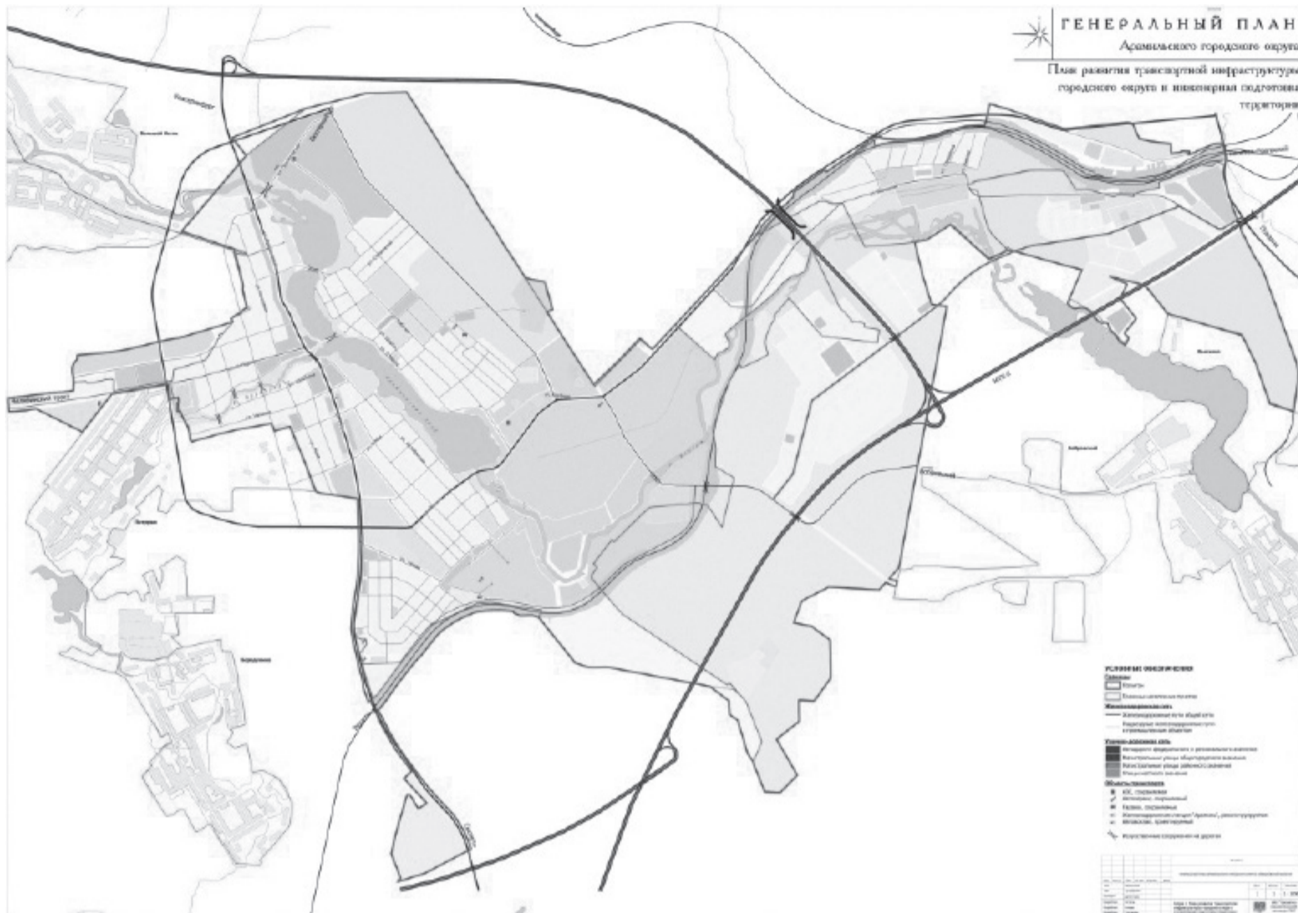
Схема 4. План размещения на территории городского округа объектов капитального строительства местного значения и определения территорий первоочередной подготовки проектов планировки