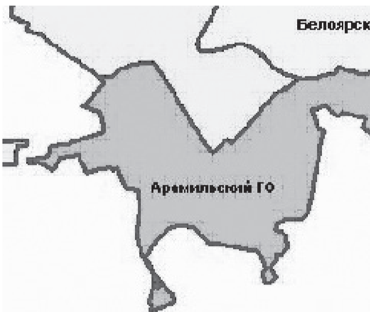
Рисунок 1. Местоположение Арамилевского ГО в системе расселения

Административным центром Арамилевского городского округа является