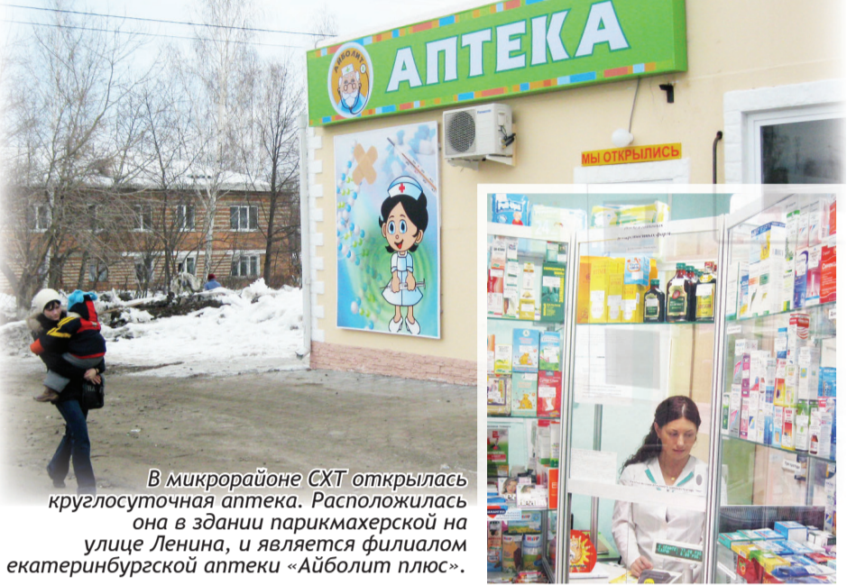
В микрорайоне СХТ открылась круглосуточная аптека. Расположилась она в здании парикмахерской на улице Ленина, и является филиалом екатеринбургской аптеки «Айболит плюс».

Здесь имеется широкий выбор лекарств, как в свободной продаже, так и по рецептам.