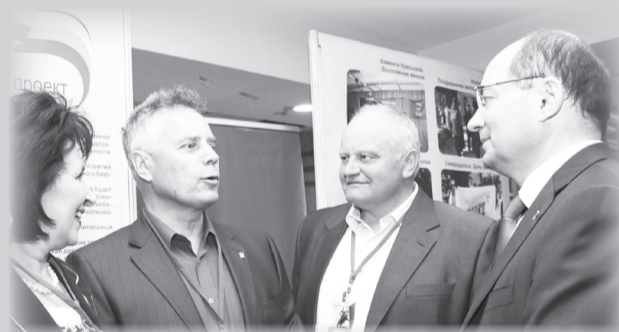
Идею создания народного фронта с делегатами конференции «Единой России» обсудил губернатор Свердловской области Александр Мишарин

Но это будет лишь первый шаг. Присоединение к Народному фронту - не цель, а средство, для реализации своих идей по улучшению жизни. Как пообещал лидер партии «Единая Россия» Владимир Путин, участники Народного фронта смогут принять участие в праймериз, проводимых партией, и получить 150 из 600 мест в предвыборном списке в Госдуму. Напомним, о создании Общероссийского народного фронта Владимир Путин объявил в начале мая в Волгограде, заявив тогда, что любые заинтересованные общественные организации, разделяющие взгляды «Единой России», могут участвовать