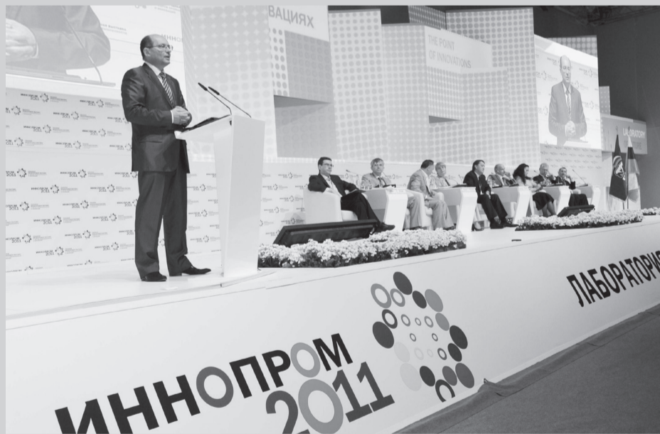
Губернатор Александр Мишарин отметил, что Народная программа должна создаваться жителями области

Затем слово было предоставлено модераторам секций, которые и презентовали выбранные в ходе тематического обсуждения проекты. Шесть проектов, шесть направле-