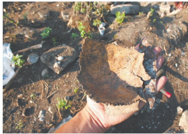
Среди находок - фрагменты черепа