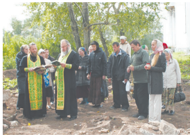
Первый молебен отслужили в минувшую субботу