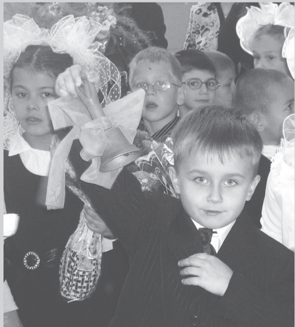
1 сентября первый звонок прозвучит для 280 первоклассников Арамили

Накануне учебного года на модернизацию образования Свердловской области было выделено 460 миллионов рублей из федерального бюджета. Эти средства пойдут на оборудование и переоборудование кабинетов и спортзалов, лабораторий, столовых, на покупку автобусов для удаленных школ и на повышение квалификации педагогов.