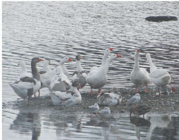
Истории из жизни