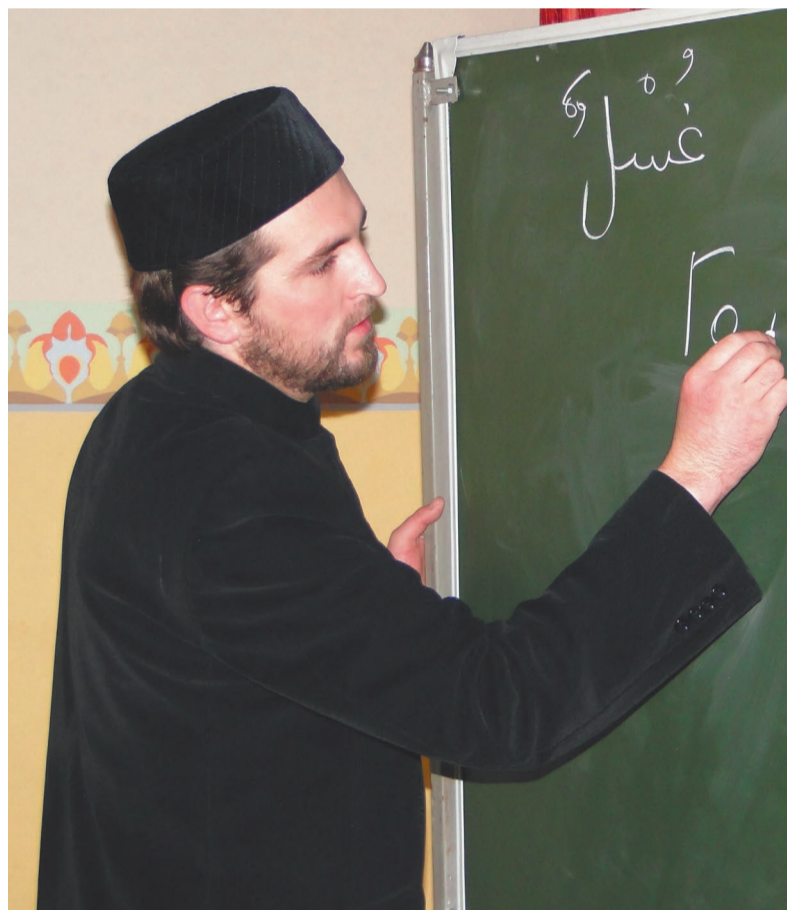
У арамильских мусульман по воскресеньям появилась возможность изучать основы ислама и арабского языка.

дежно скрыт в тени сосен, и, подходя к нему, немного теряешься. Строительство мечети на этом месте началось еще в 2008 году и продолжается до сих пор со всеми атрибутами обычной стройки. Поэтому никакого парадного входа, внутрь ведет обычная железная дверь, а рядом с помещением для занятий мирно соседствует строительный инвентарь.