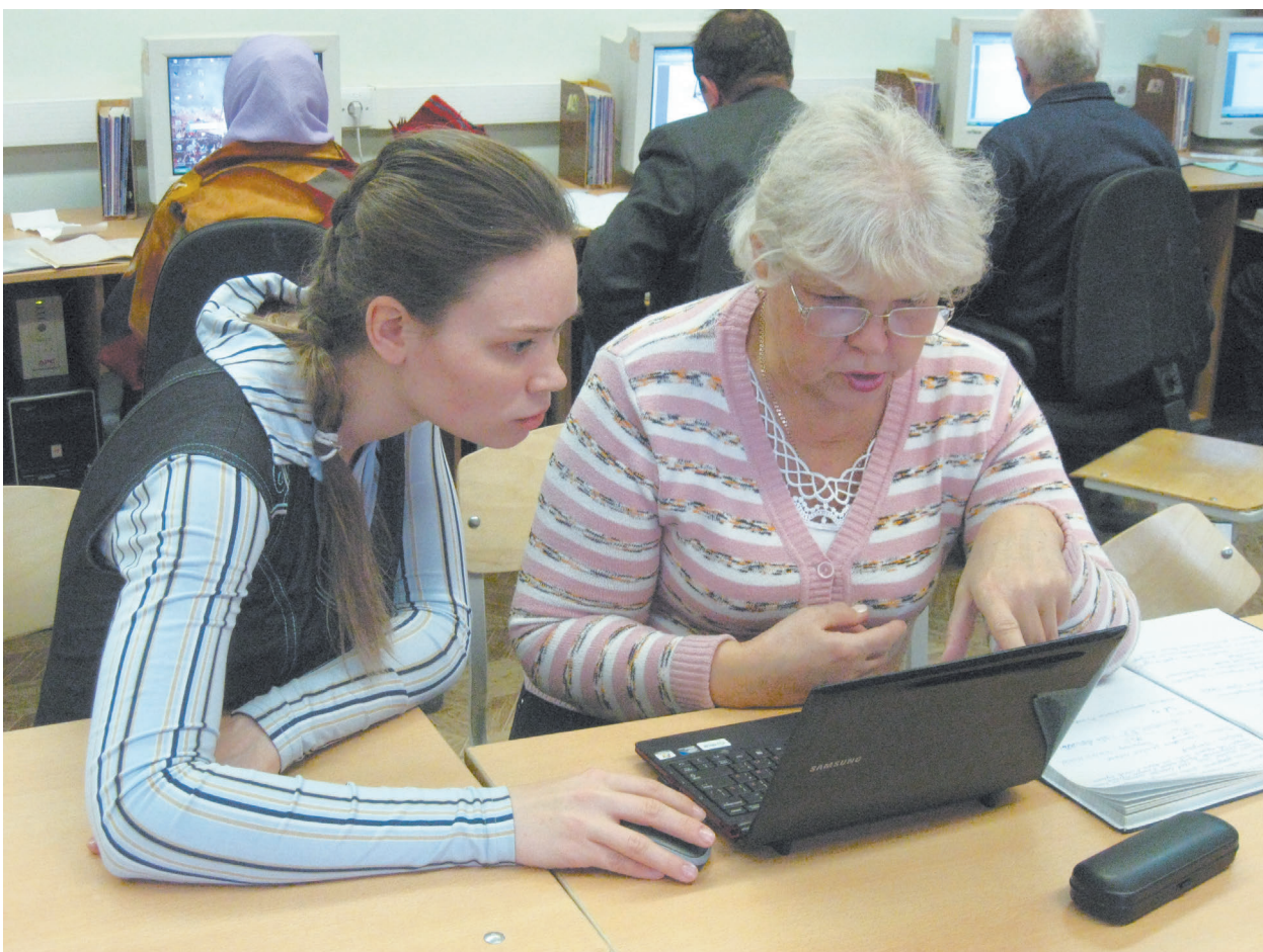
В центре внимания